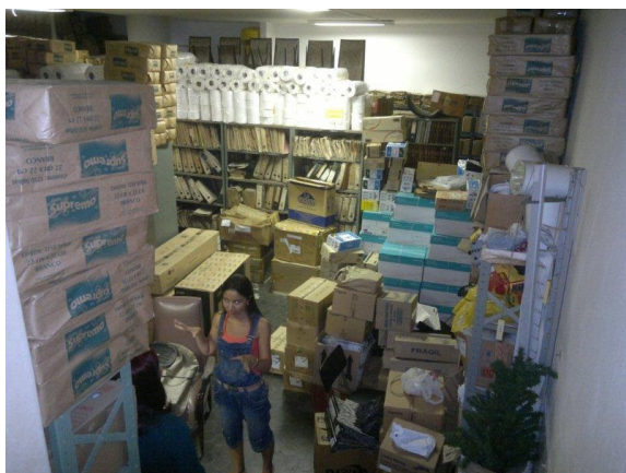
Figura 1 - Arquivo Histórico em 2010