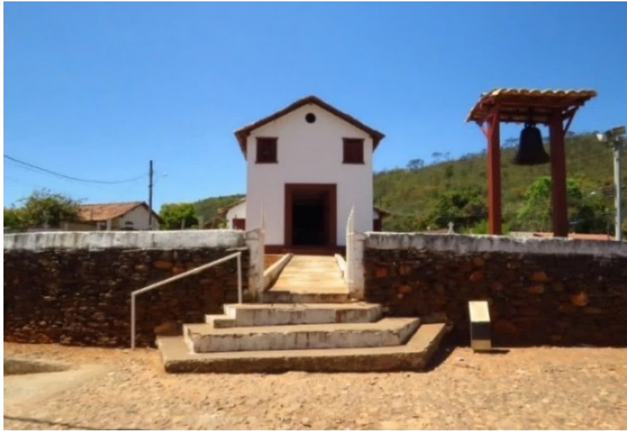
Figura 2 - Capela de Santo Antônio - Pompéu – Sabará