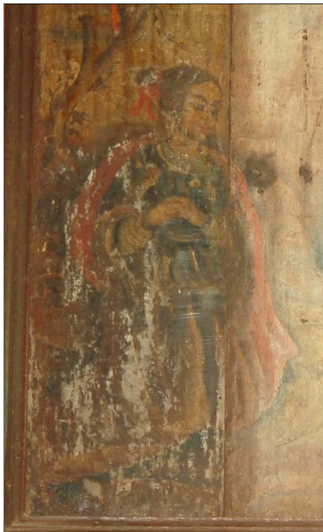
Figura 7 - Detalhe do painel parietal "Milagre do caldeirão de água fervente".