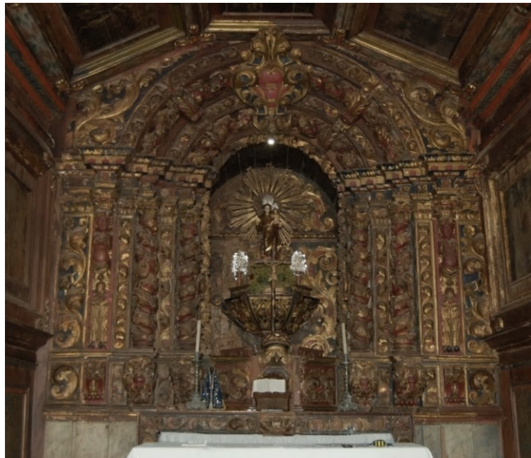
Figura 4 - Altar-mor - Capela de Santo Antônio - Pompéu – Sabará