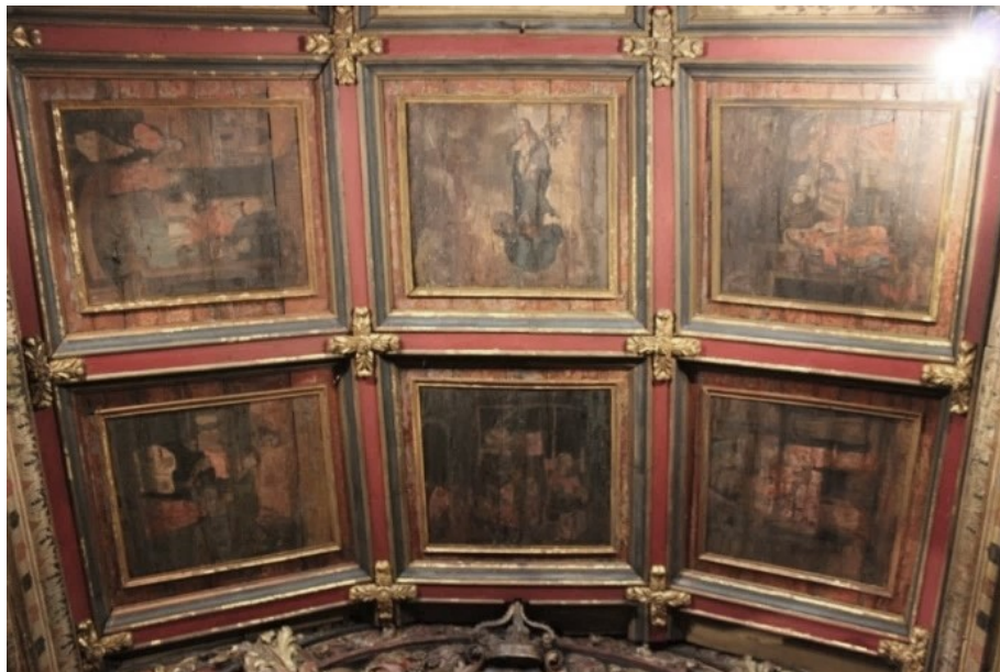
Figura 1- Forro de caixotões - Capela-mor - Capela de Nossa Senhora do Ó