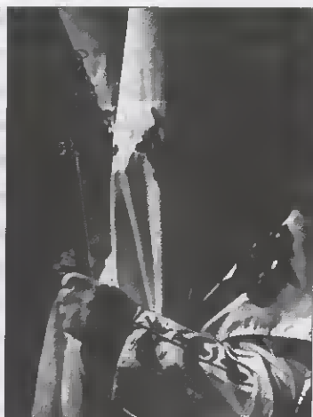
Figura 4. Participante da procissão da Semana Santa em Sevilla (Espanha).