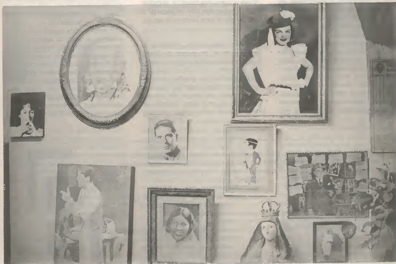
Flagrante do acervo do Projeto Memória.

A classe artística, de modo geral, não acreditava que a Divisão de Documentação fosse uma realidade. Prevalecia o receio de se enviar doações