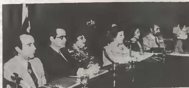
Flagrante da Sessão Solene de Abertura do 1º Seminário Nacional de Arquivos Municipais.