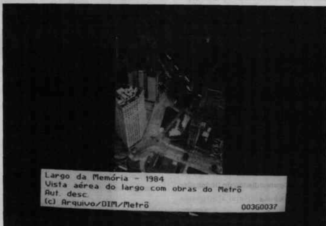
Largo da Memória - 1984 Vista aérea do largo com obras do Metrô