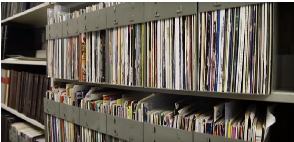
Figura 1 - Coleção Nº 1 – 23 escaninhos com total de 995 fascículos, indisponível à consulta

Durante a pesquisa, a discente apresentou cinco (5) papers em Congressos Nacionais e Internacionais em que mostrou as etapas da investigação que durou dois anos e culminou com a disposição do material no sistema Pergamum, podendo atender aos públicos internos e externos, e nas prateleiras da biblioteca da escola. Vale dizer que o projeto de colocar o material na biblioteca contou com a participação dos alunos do Curso de Design que elaboraram a identidade visual da Coleção. Abaixo, apresentamos uma sequência de imagens (figuras 1, 2 e 3) que traz a coleção disponível no segundo andar, antes do trabalho de Flávia, e depois, na biblioteca.