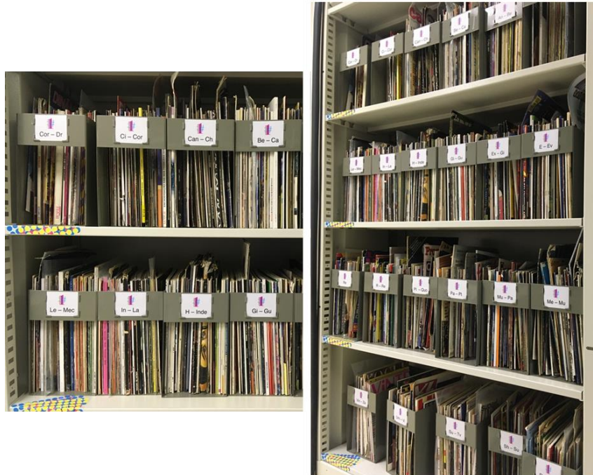
Figura 2 - Materiais disponíveis na biblioteca da escola para consulta pública contando com identidade visual