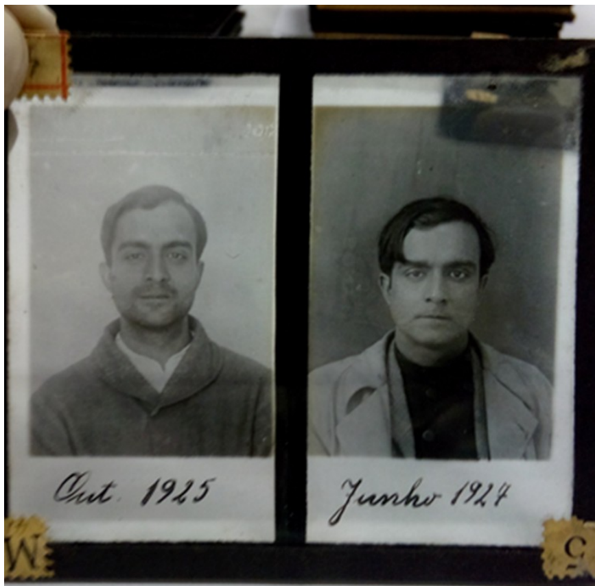
Figura 1 Exemplo de registro fotográfico comparativo de antes/depois - Asilo de Alienados do Juqueri.