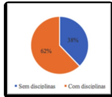
Gráfico 1 - Relação dos Cursos de Biblioteconomia com Disciplinas Arquivísticas

Desses cursos que possuem ao menos uma disciplina da área, quatorze (14) cursos possuem disciplinas de Gestão de Documentos, Fundamentos Arquivísticos e Organização de Arquivos, como carga horária obrigatória e, nove (9) somente com disciplinas optativas. Quatorze (14) outros cursos não possuem nenhuma disciplina em sua matriz curricular, o que representa 38% do total de cursos.