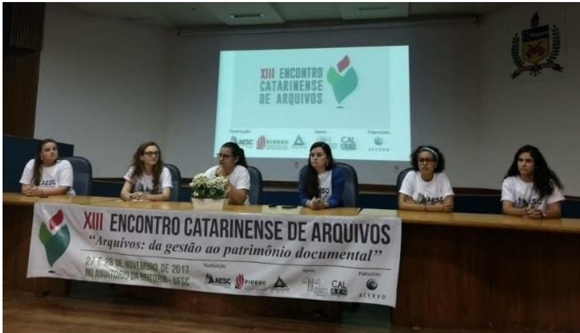
Figura 5 - Atual diretoria em aprovação de moções em assembleia durante o XIII ECA, 2017