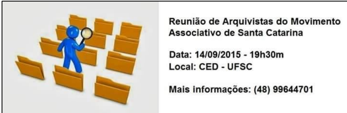
Figura 1 - Convite veiculado para convocar a comunidade arquivística

catarinense a convocação de uma Reunião de Arquivistas do Movimento Associativo de Santa Catarina nas dependências da UFSC.