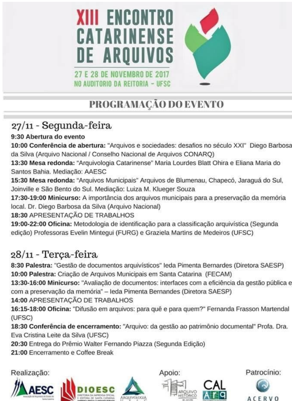
Figura 4 - Banner de divulgação do 13º Encontro Catarinense de Arquivos

A programação do evento contou com conferências, palestras, mesas redondas, minicursos, oficinas e apresentações de trabalhos que foram submetidos de acordo com eixos temáticos pré-estabelecidos: Eixo 1: Gestão de Documentos; Eixo 2: Patrimônio Documental; Eixo 3: Interdisciplinaridade e Arquivologia.