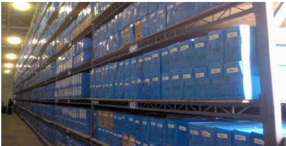
Figura 1. Foto do local de custódia em 12/07/2007

É utilizado um software de gerenciamento de documentos (e-doc), que possibilita a indexação das caixas e dos documentos, de acordo com os critérios estabelecidos pelo cliente. Seu acesso é controlado pelo administrador do galpão, e somente pessoas autorizadas com senha podem fazer consultas.