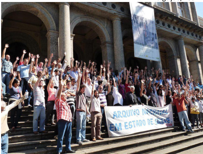
Servidores na escadaria do Arquivo Nacional