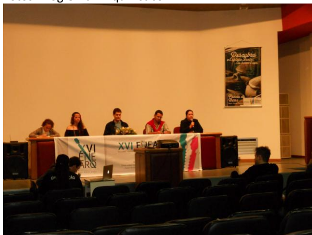
Mesa de abertura do XVII ENEArq