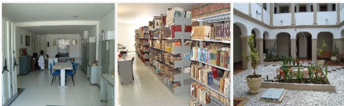
Figura 2 Espaços que integram o Centro Cultural dos Capuchinhos - CCCap

Hoje o acervo documental se encontra acondicionado em caixas com sistemas de arquivos deslizantes, acessível a todos os pesquisadores.