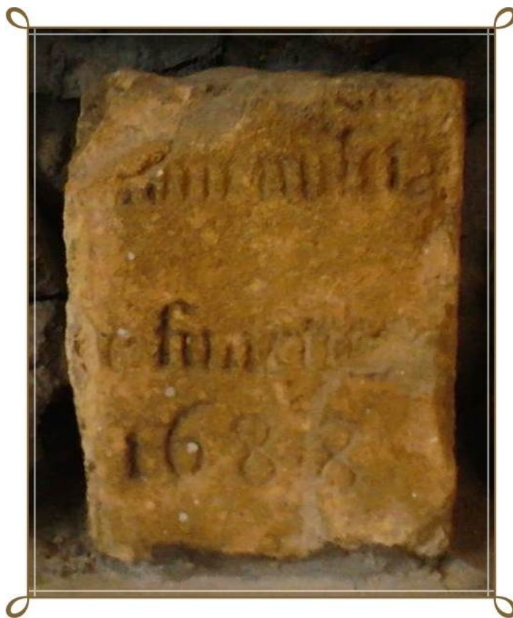
FIGURA 1 - Pedra que marca o encerramento da construção do Hospice Nossa Senhora da Piedade, primeira residência missionária dos Capuchinhos da Bahia e do Brasil, em 1688.