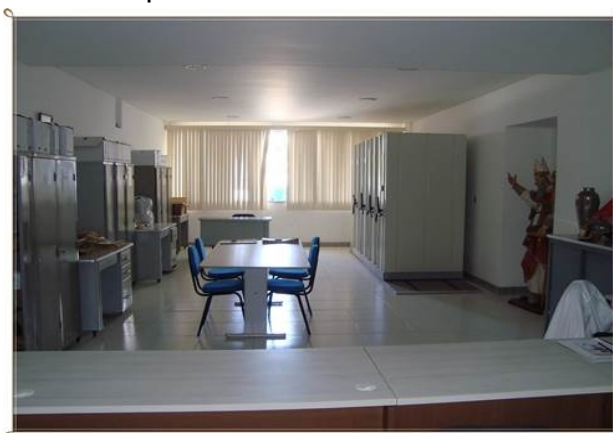
FIGURA 3 - Visão geral do Arquivo Histórico Nossa Senhora da Piedade

O AHNSP não está capacitado apenas como um espaço de salvaguarda dos manuscritos dos séculos XVIII e XIX, mas como produtor e divulgador das práticas missionárias capuchinhas de modo a ressaltar as suas especificidades no espectro missionário baiano. Está capacitado também a atuar como aglutinador das informações relativas a este período histórico das missões religiosas na Província da Bahia e Sergipe, servindo como instrumento de resgate, de busca e de pesquisa da base teórica imprescindível à reconstrução da história.