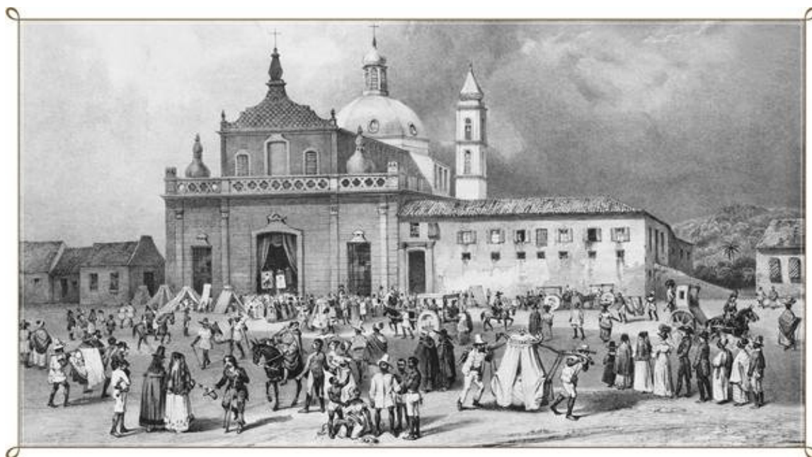
FIGURA 2 - Cópia de gravura de J. M. Rugendas, reproduzindo o hospício da Piedade nos anos de 1827-35.