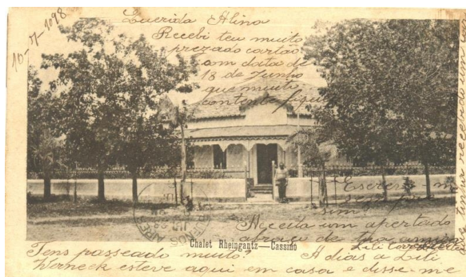
FIGURA 01 – Foto-postal – Chalé da Família Rheigantz

No acervo de fotografias são encontradas imagens que registram diversos aspectos da cultura local no final do século XIX até meados do século XX. Sendo assim, no mesmo podemos observar através do acervo fotográfico aspectos do crescimento urbano e a evolução da em termos econômicos. São encontradas no acervo imagens dos primeiros chalés que deram origem ao Balneário Cassino, vistas do centro da cidade, imagens da construção do Porto do Rio Grande e das obras de construção dos Molhes da Barra (para facilitar o acesso dos navios). Além dessas, existem também muitas imagens das indústrias de tecidos, charutos, e do refino de petróleo que se instalaram na cidade neste período.