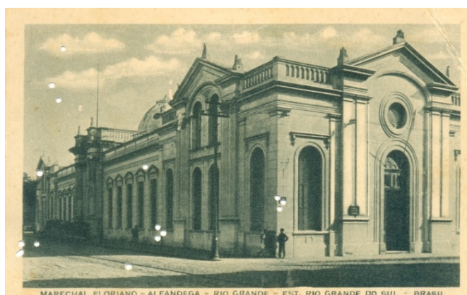
FIGURA 14 – Alfândega esquina com as ruas Marechal Floriano e Ewbank