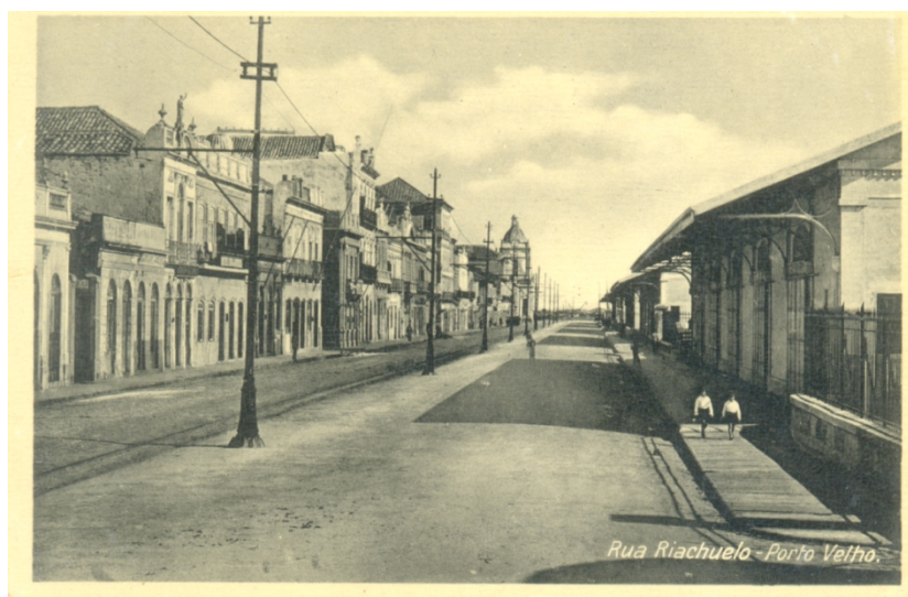
FIGURA 03 – Rua Riachuelo – Armazéns do Porto e Alfândega ao fundo