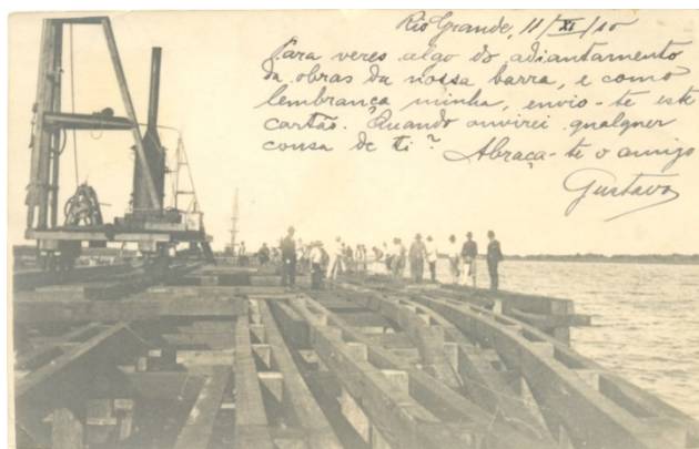
FIGURA 07 – Construção do Porto Novo