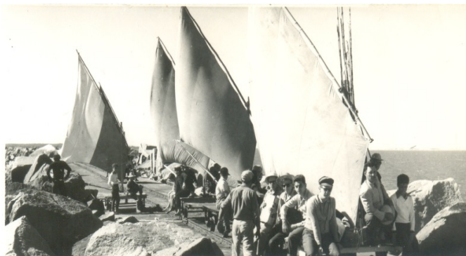
FIGURA 10 – Molhes da Barra do Rio Grande - Vagonetas utilizadas para transporte até o fim dos trilhos