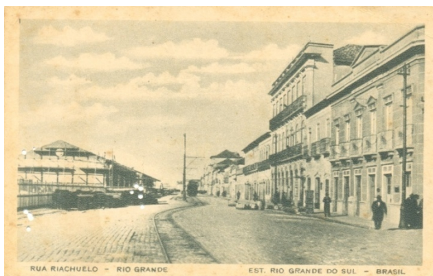
FIGURA 06 – Rua Riachuelo – Armazéns do Porto em construção e comércio