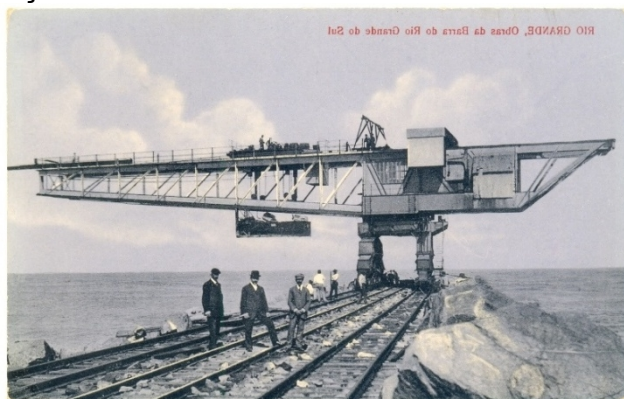
FIGURA 08 – Construção dos Molhes da Barra