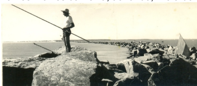
FIGURA 11 – Pescaria nos Molhes da Barra, ao fundo, Praia do Cassino