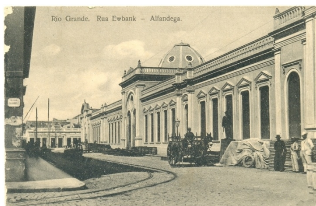
FIGURA 13 – Vista lateral da Alfândega, Rua Ewabank