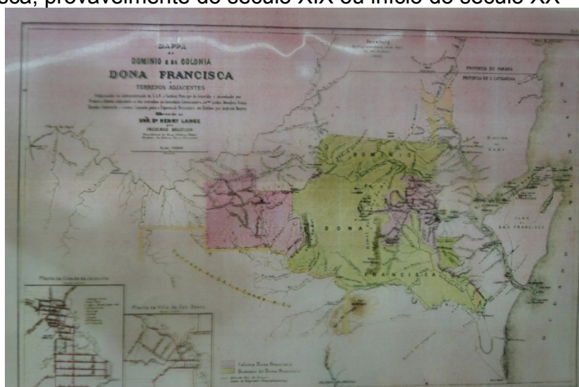
FIGURA 2 – Mapa de medição e demarcação das terras do Domínio e da Colônia Dona Francisca, provavelmente do século XIX ou início do século XX

A demarcação dessas terras foi realizada nos anos de 1845 e 1846, pelo engenheiro Jerônimo Coelho, e o registro cartográfico a seguir nos possibilita observar sua dimensão.