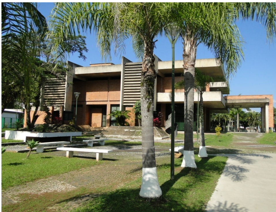
FIGURA 1 - Arquivo Histórico de Joinville.

Por fim, informa-se que, inicialmente, o AHJ funcionou em uma das salas da Biblioteca Municipal “Pref. Rolf Colin”. No ano de 1986, conforme se observa na imagem a seguir, foi inaugurada sua nova sede construída por intermédio de um convênio com a República Federal da Alemanha equipado com um sistema artificial de climatização.