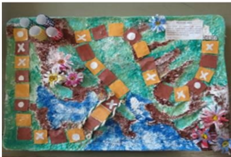
Figura 5- Jogo da vida confeccionado com papel artesanal reciclado

(palavras em português e em inglês); o Jogo da memória , e o Jogo da velha conforme ilustram as figuras 5 e 6.