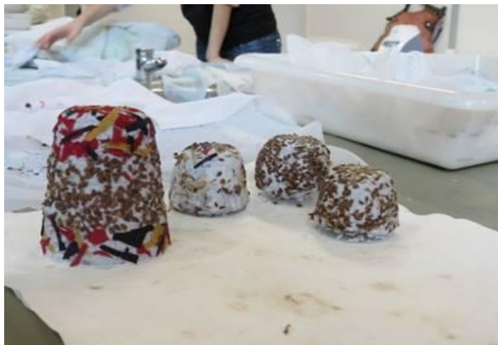
FIGURA 2 – Copos confeccionados com material reciclado

modelagem em copos descartáveis reutilizados. Os copos modelados foram decorados pelos participantes com sementes variadas trazidas pela equipe, o que pode ser visualizado na Figura 2.