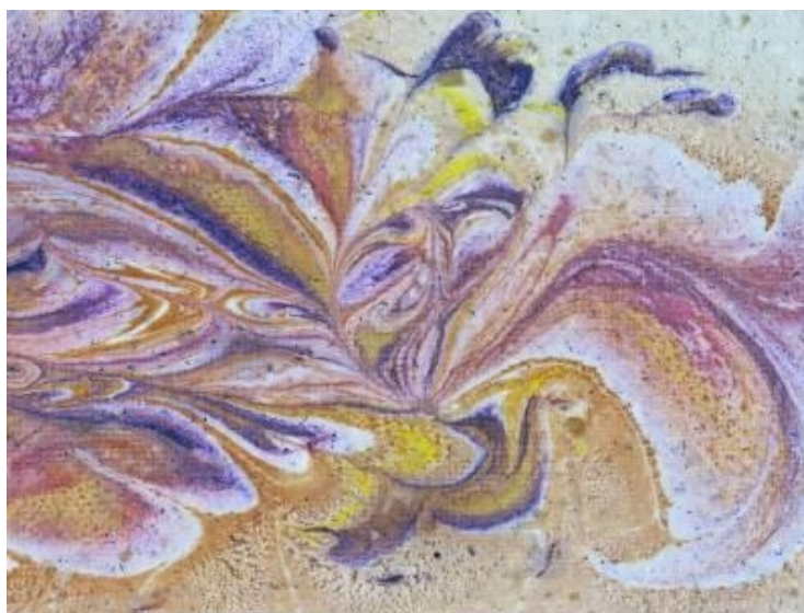
FIGURA 3 – papel artesanal marmorizado na segunda oficina do projeto

bandejas retangulares, onde é inserida a mistura para a aplicação desta técnica, sendo que, neste caso, são utilizados papéis artesanais reciclados, o que pode ser observado na Figura 3.