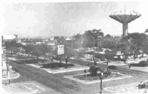
Vista Parcial de Ceilândia (Caixa D'água). Data: 27/05/2002.