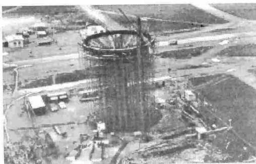
Vista de Ceilândia (Caixa D'água). Autor: Não identificado. Data: 11/01/1973. Reprodução: Luiz Borges Neto. Fundo: SCS.

Chefe de Gabinete Luiz Fernando C. Silva