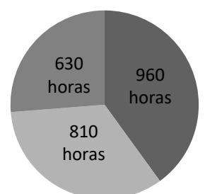
Gráfico 2. Proporção entre os núcleos de formação no currículo (2009-2014)

Nota-se, na primeira versão do currículo, um modelo de formação fortemente ancorado no pressuposto de que a formação do arquivista equivale à formação do profissional da informação. Não por acaso, o conteúdo específico da Arquivologia ocupava, nesta proposta, pouco menos de 35% do curso de graduação.