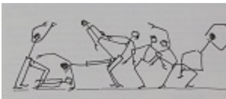
Figura 4. Estudo de movimento do espetáculo Caminho (1991)

Assim, as Figuras 4 e 5 também pertencem a categorias documentais diferentes conforme nossa classificação, estando a primeira alocada na categoria Processo de Criação, e a segunda, resultado desse estudo, materializada a partir de uma fotografia, na categoria Registros, ambas arranjadas na série Criação Artística.