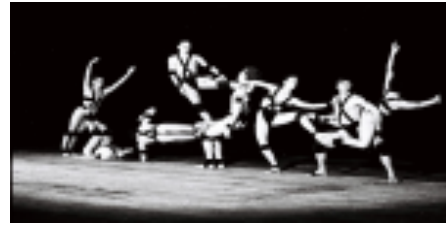
Figura 5. Registro fotográfico do espetáculo Caminho (1991)

A importância de guardar estes registros em um mesmo dossiê nos possibilita entender toda a proposta do espetáculo, mesmo não tendo a oportunidade de assisti-lo. Nesse caso, em específico, Robatto tinha como proposta “estudar o resultado plástico das estruturas corporais, como as técnicas de equilíbrio, apoio e sustentação” (ROBATTO, 2017, p.123).