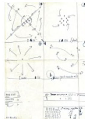
Figura 9. Estudo do movimento no espaço cênico espetáculo Dona Cláudia (1979)

Já, na figura seguinte, o estudo é do movimento dos bailarinos no espaço cênico (palco), observando que o estudo do tempo aparece na margem dos desenhos.