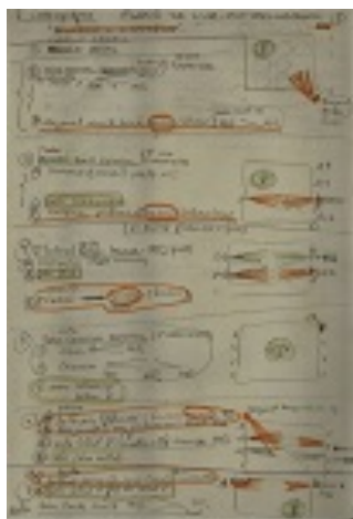
Figura 10. Plano de iluminação espetáculo O universo imaginário de Villa-Lobôs (1987)

Abaixo, apresentamos a imagem de outros tipos de estudo, como na Figura 13, em que Robatto faz um estudo do plano de iluminação para espetáculo O universo imaginário de Villa-Lobôs.