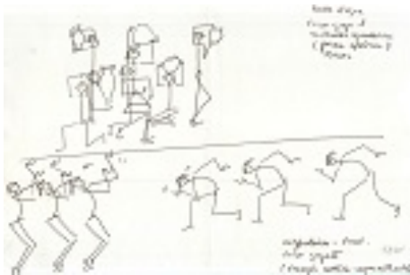
Figura 7. Estudo de movimento, espetáculo Sina (1979)

Nesses tipos documentais é possível reconhecer, a partir do método de análise do movimento proposto por Kurt