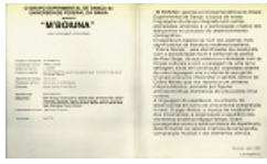
Figura 2. Programa (verso) do espetáculo M'Boiuna (1980)