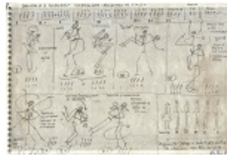
Figura 8. Notação coreográfica com estudo de tempo e movimento, Bolero (1982)

É possível perceber na Figura 8 dois tipos de notação: os desenhos que representam os movimentos dos bailarinos e os traços, que representam o estudo do tempo de cada movimento.