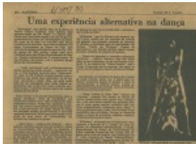
Figura 3. Notícia de jornal do espetáculo M'Boiuna (1980)

Em seu acervo, é possível encontrar diversos estudos, notas e textos referência (livros, artigos, clippagens de jornais) utilizados no processo de criação coreográfica. Todos organizados nos respectivos dossiês por espetáculo.