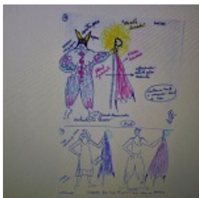
Figura 11. Desenho para figurino espetáculo Sertania (1983)

O acervo apresenta uma variedade de tipos documentais, que não cabe aqui expor em sua totalidade. Mas vale ressaltar que alguns são facilmente identificados, tais como relatório, ofício, ata, diploma, recibo, declaração. Outros, porém, precisam ser analisados mais cuidadosamente dentro do seu contexto de produção para serem corretamente nomeados.