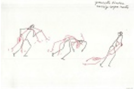
Figura 6. Estudo de movimento, espetáculo Sina (1979)

Apresentamos alguns tipos documentais do acervo de Lia Robatto que já foi possível nomear após o entendimento dos conceitos e do contexto da dança. Como é o caso das Figuras 6 e 7, que retratam estudos de movimento .