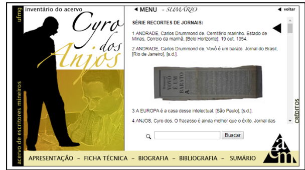
Figura 2. Descrição dos itens da série “recortes de jornais” do arquivo de Cyro dos Anjos, orientada pelas normas de redação de referência bibliográfica (ACERVO..., s.d.)

A controvérsia não se esgota aí. Quando se passa do arranjo para a descrição, afloram problemas de outra natureza. Trata-se da maneira de “nomear” os documentos, que perpassa o entendimento e o reconhecimento das espécies e tipos documentais. Não tem sido incomum observar, quando estão em jogo os recortes de jornal, a adoção de estratégias incongruentes, não raro orientadas pelo conjunto de elementos que compõem a referência bibliográfica, como se a autoria, o título e a data de publicação dessem conta de substituir a denominação dos documentos pela espécie ou, pior, induzir a compreensão do conteúdo, do potencial informativo ou mesmo dos atributos funcionais que garantem o real sentido dos documentos em um arquivo.