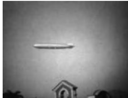
Fotogramas Alberto de Sampaio

Os filmes de Alberto de Sampaio são apenas uma pequena mostra dos tesouros que se escondem em nossas cinematecas e arquivos. Os filmes domésticos são parte essencial da nossa memória visual e devem ser valorizados como documentos da cultura pelo seu valor histórico, sociológico e estético. A entrada dessas imagens nos arquivos públicos é, na maior parte dos casos, o que garante a sua sobrevivência, já que no universo familiar não é raro o descarte desse tipo de material. Rolos de filme podem ser facilmente jogados fora em uma faxina geral, em uma mudança de casa. Por falta de espaço, de uso ou de interesse, imagens familiares tomam os mais estranhos rumos e, quando dão sorte, sobrevivem guardadas em baús fechados ou em feiras de antiguidade. A chegada em um arquivo público, os cuidados de uma preservação adequada, infelizmente ain-