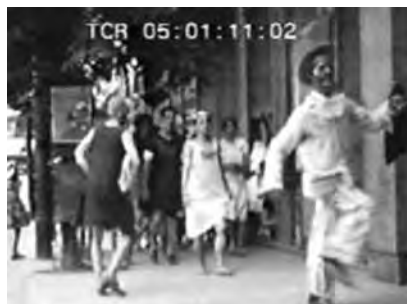
Fotogramas Família Costa Bello