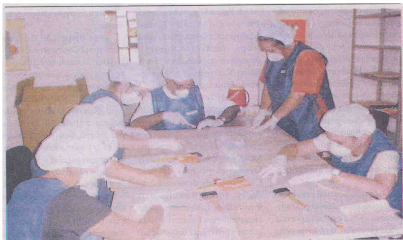
Curso na Fundação Pró-Memória inicia a conservação preventiva dos arquivos

Nesse biênio 2002-2004, tivemos o oferecimento do Curso de Conservação Preventiva em Livros e Documentos, para várias turmas compostas por servidores e voluntários da Fundação, bem como para alunos da Fundação Educacional de São Carlos (vide fotos a seguir).