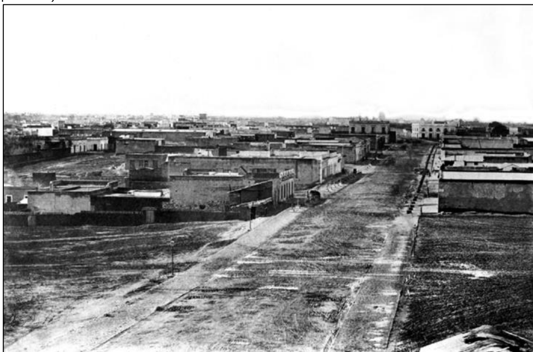
Figura 9: Praça Cagancha antes do início da construção da Columna de la Paz , 1965 (reprodução posterior).