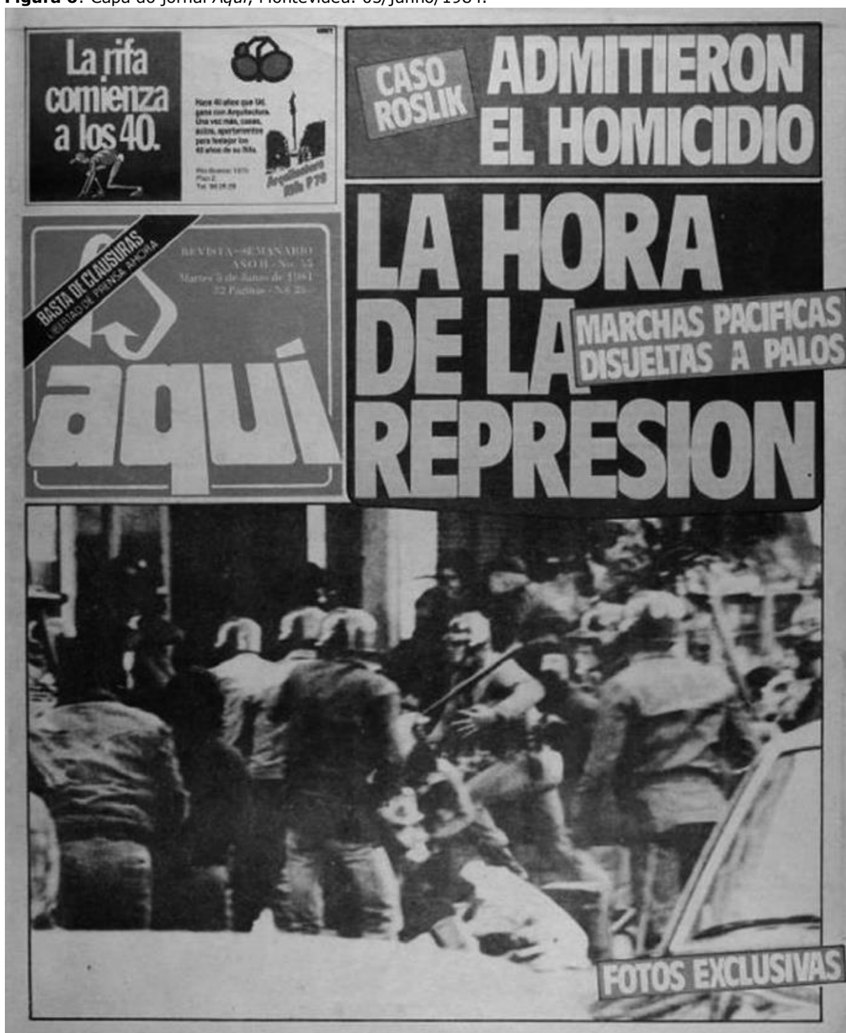
Figura 6: Capa do jornal Aquí , Montevideu. 05/junho/1984.