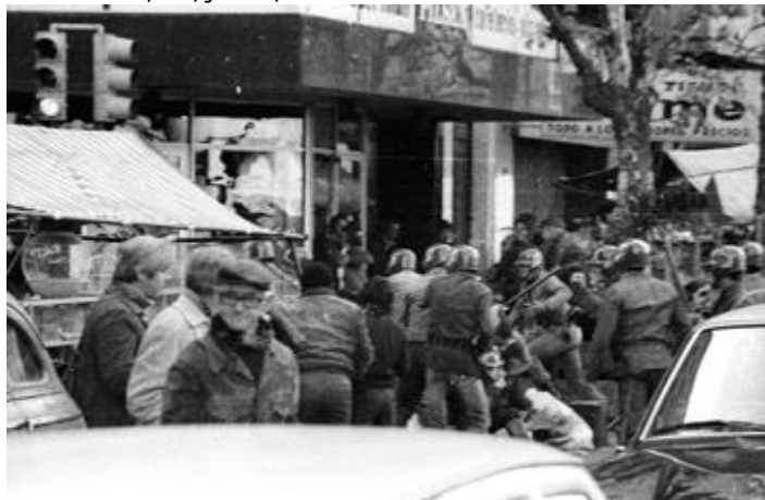
Figura 2: Repressão a uma manifestação antiditatorial. Agência Camaratres , 04/junho/1984.

Fonte: Centro de Fotografia de Montevideo -Fotos 0026_26FPCT.