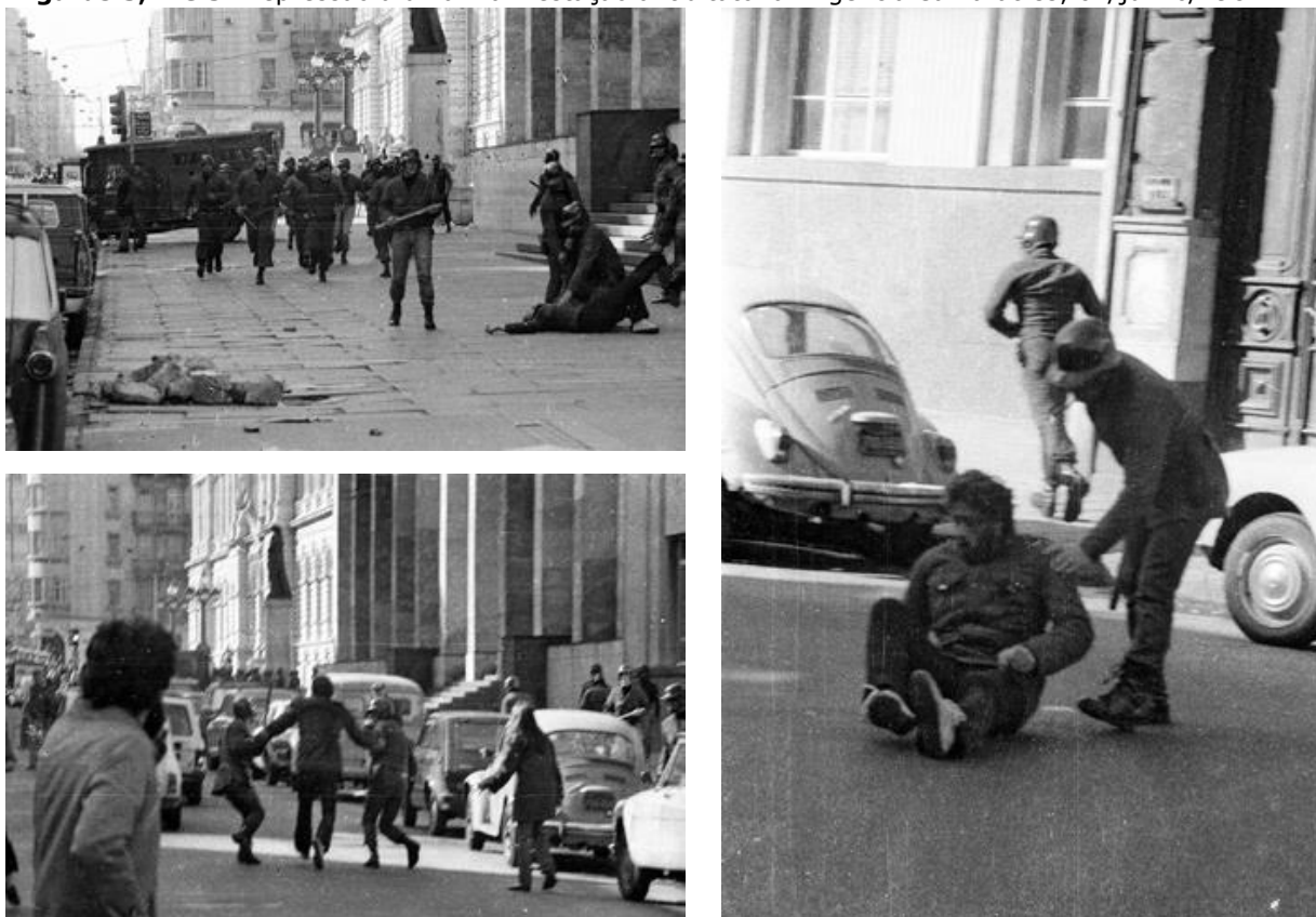
Figuras 3, 4 e 5: Repressão a uma manifestação antiditatorial. Agência Camaratres , 04/junho/1984.

Fonte: Centro de Fotografia de Montevideo -Fotos 0026_31FPCT , 0026_35FPCT e 0026_33FPCT ,