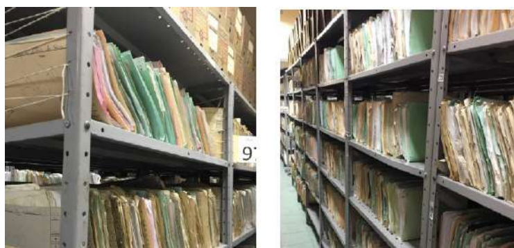
FOTOGRAFIAS 6: Após a leitura de estante

A quinta fase dos grupos também foi realizar a leitura de estantes através dos dígitos de cada prontuário, realizando desta forma a ordenação instruída pelo SAME. O resultado desta leitura de estante foi a identificação dos dígitos nas estantes, conseguindo a procura rápida e eficaz.