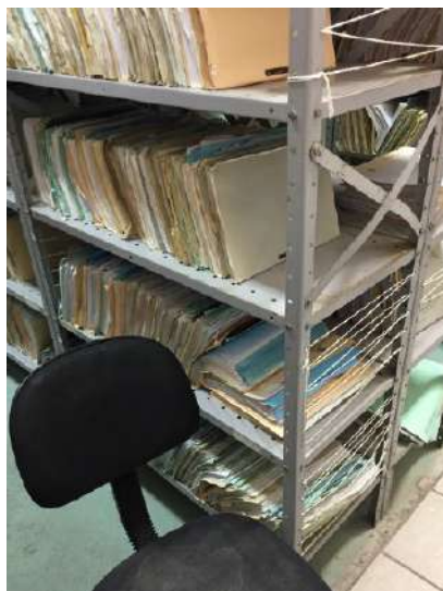
FOTOGRAFIA 2: Barbantes nas laterais das estantes

A quarta fase dos grupos foi colocar barbante nas laterais das estantes para que os prontuários de óbitos fiquem melhor acomodados.