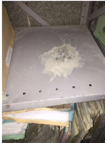
FOTOGRAFIA 1: Sujeiras nas estantes e prontuários no SAME