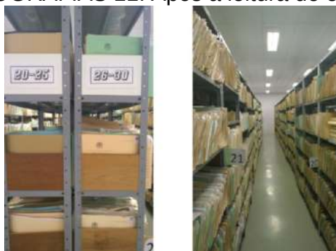
FOTOGRAFIAS 11: Após a leitura de estante

A terceira fase dos grupos foi realizar a leitura de estantes através dos dígitos de cada prontuário, realizando desta forma a ordenação instruída pelo SAME. O resultado desta leitura de estante foi a identificação dos dígitos nas estantes, conseguindo a procura rápida e eficaz.