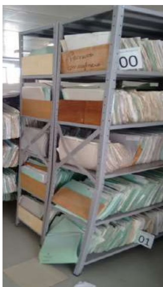
FOTOGRAFIA 10: Localização dos prontuários de pacientes ativos

A segunda fase dos grupos também foi identificar como é lido o dígito-terminal dos prontuários do HU/UFSC. Compreendido a disposição das etiquetas de identificação foi identificado o dígito terminal com a maior necessidade das numerações.