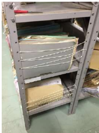
FOTOGRAFIA 5: Barbantes nas laterais das estantes

A quarta fase dos grupos também foi colocar barbante nas laterais das estantes para que os prontuários de óbitos fiquem melhor acomodados.