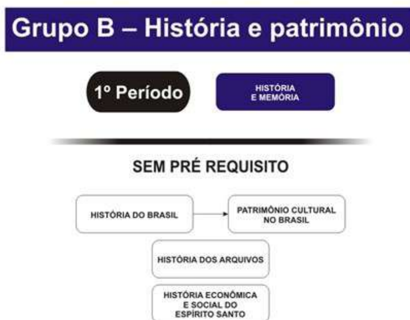
FIGURA 2: Encadeamento das disciplinas do grupo B – História e Patrimônio.

A Figura 2 apresenta um fluxograma com a disposição das disciplinas da Quadro 3 em relação ao seu encadeamento e pré-requisitos. A disciplina marcada em azul é obrigatória, e as brancas são optativas.