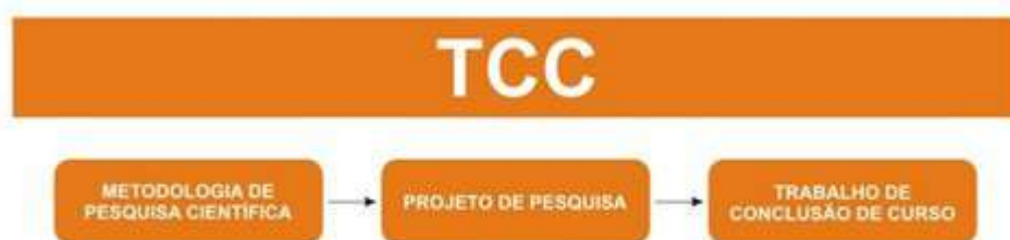
FIGURA 4: Encadeamento de pré-requisitos para o TCC. As três disciplinas são obrigatórias

As principais mudanças referentes ao Trabalho de Conclusão de Curso (TCC) se deram no âmbito da carga horária e desenvolvimento do TCC. No PPC anterior havia apenas a disciplina de TCC com uma carga horária total de 180 horas. Com a reforma, o TCC passou a ter uma carga horária total de 240 horas, diluídas em duas disciplinas, a saber: Trabalho de Conclusão de Curso (180h) e Projeto de Pesquisa (60h). Espera-se que o aluno realize um estudo monográfico ou desenvolva um artigo acadêmico, a ser desenvolvido na disciplina Trabalho de Conclusão de Curso , a partir de um projeto elaborado e aprovado na disciplina Projeto de Pesquisa . A pesquisa pode ser realizada por até dois estudantes. Além disso, a disciplina Metodologia de Pesquisa Científica (60h), que anteriormente era optativa, passa a ser obrigatória e pré-requisito da disciplina Projeto de Pesquisa . Dessa forma, os alunos terão maior embasamento teórico sobre como realizar uma pesquisa.