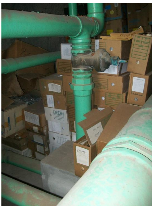
Figura 4 – Caixas-arquivo junto às tubulações hidráulicas no Centro de Ciências da Saúde

Neste sentido, a realização do diagnóstico, também contará com outras atividades a fim de se chegar à real situação dos arquivos nas unidades/subunidades da UFSM. A metodologia de trabalho a ser utilizada vem sendo a mesma para todos os setores, exceto as etapas adicionais que, por ventura, surgirão em função das especificidades que alguns acervos poderão apresentar. Assim, em cada unidade/subunidade tem sido realizado um estudo mais aprofundado de seu universo documental. Documentos que reflitam sua criação e/ou reformulação, tais como regimentos e estatutos, são analisados. Entrevistas são feitas com os colaboradores das unidades/subunidades a fim de compreender as funções e atividades que dão origem aos documentos. Concomitantemente, está sendo realizado o levantamento da produção documental e a partir da definição dos tipos documentais produzidos e sua correspondência com as funções/atividades será possível o estabelecimento do processo de classificação documental.