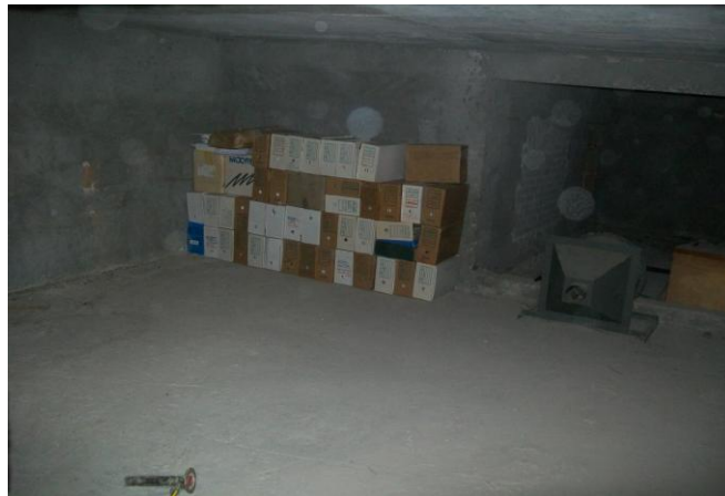
Figura 2 – Caixas-arquivo dispostas em um subsolo no Centro de Ciências da Saúde