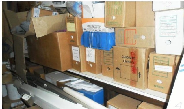
Figura 1 – Caixas-arquivo sobrepostas umas às outras e misturadas a outros materiais (Centro de Ciências Rurais)