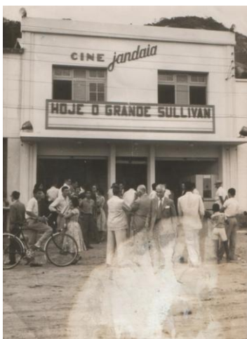
Imagem 4 – Foto do Cine Jandaia: O cinema estreou com o filme O Grande Sullivan, em 22 de julho de 1955. Sala de propriedade da Empresa Dionysio Abaurre Com.Ltda. Localizado na Av. Princesa Isabel, Centro de Vitória.