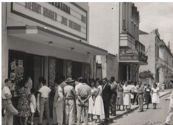
BR.CINEMAES.CAR.073. Inauguração do Cine Vitória, Centro, Vitória, com o público aguardando a sessão do filme Bagdá. Vitória. 04 out. 1950.

O acervo foi contemplado pelo edital 32/2012 do Fundo de Cultura do Estado do Espírito Santo – FUNCULTURA, referente a Projetos Culturais e Concessão de Prêmio para Inventário, Conservação e Reprodução de Acervos no Estado do Espírito Santo, que irá possibilitar a elaboração de um inventário analítico das fotografias que será depositado após o tratamento no APEES. O acervo conta ainda como forma de difusão e para contribuições de depoimentos e novas aquisições de imagens com o blog http://salasdecinemadoes.blogspot.com.br/ , onde já recebemos fotografias, depoimentos e vários acessos inclusive de outros países, como Rússia, Argentina, Índia, Portugal, Alemanha e Reino Unido.