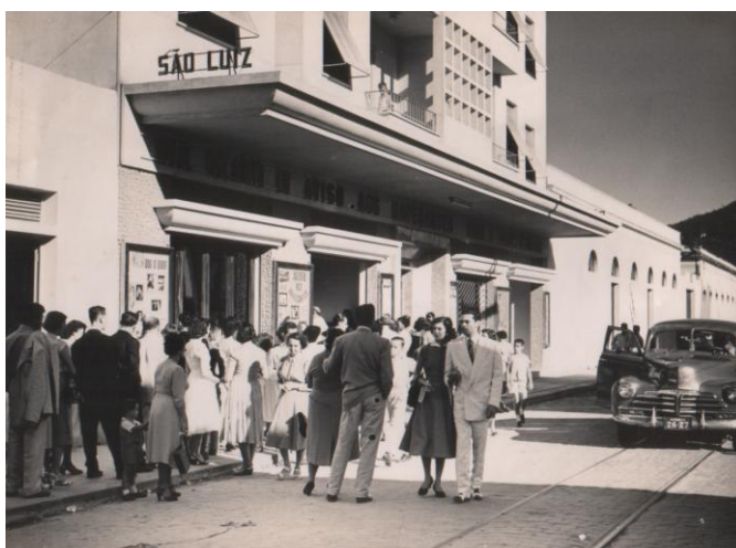
Imagem 5 - Cine São Luiz, 1951 – Inauguração com presença de autoridades e o elenco do filme Aviso aos Navegantes, uma chanchada de grande bilheteria lançado pela Atlântida.