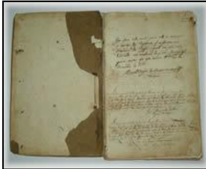
Fig. 2 A figura acima é uma imagem do livro de registros de batismo da paróquia de São Miguel de Taipú (município paraibano) datado de 1811 a 1820, e faz parte do acervo da Diocese Paraibana – Arquivo Eclesiástico.

O Arquivo consta dos seguintes Instrumentos de pesquisa: Guia do Arquivo Eclesiástico da Paraíba, Inventário do Arquivo Eclesiástico da Paraíba, Inventário do Grupo Fechado do Centro de Documentação e Publicações Populares - CEDOP (1978-1992), Catálogo da Coleção de Fotografias (1905-1989), Catálogo dos Projetos Arquitetônicos (1961-1990), Catálogo do Arquivo Pastoral da Terra (1976 –1992), Catálogo da Produção Intelectual de Dom José Maria Pires (1966-1995), Catálogo do Jornal A IMPRENSA (1897-1968) e Catálogo dos Periódicos.