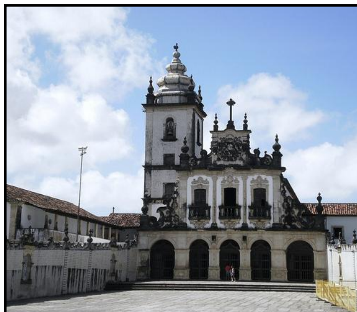
Fig. 1 A figura acima é uma imagem da fachada do Mosteiro de São Francisco, onde está localizado o Arquivo Eclesiástico da Paraíba.

O acervo é composto de documentos textuais, cartográficos, fotográficos, impressos e outros, advindos de atividades fim e meio, do Séc. XVIII, XIX e XX, distribuídos nos seguintes Fundos Documentais: Chancelaria, Seminário Arquidiocesano, Cabido Metropolitano/Colégio de Consultores, Tribunal Eclesiástico, Conselho de Assuntos Econômicos, Conselho de Presbíteros e Conselho de Pastoral.