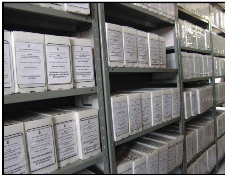
Fig. 4 A figura acima é uma imagem de um dos setores do acervo que contempla a documentação textual do Núcleo de Documentação e Informação Histórica Regional – NDIHR – UFPB.

Institucional de Bolsas de Iniciação Científica, e conta, atualmente, com a colaboração da Fundação de Apoio à Pesquisa e à Extensão - FUNAPE.