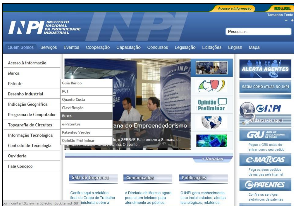
Figura 2: Portal do INPI – menu de patentes em destaque Fonte: INPI 11

Esse órgão proporciona ao cidadão o acesso aos documentos de propriedade intelectual (patente, desenho industrial, marca, programa de computador, e outros) registrados em seu sistema. O portal interativo de sua instituição dispõe de um sistema de buscas de informação tecnológica (Figura 2), disponível através de descritores ou palavras-chave, conforme os campos de conhecimento do interesse do usuário.