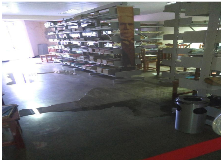
Figura 7 -Biblioteca Pública do Estado