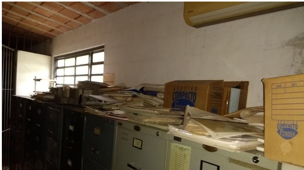
Figura 5 - Documentos da ICOMI – empresa de Comércio e Minérios/AP de seu maior monumento cultura – a Fortaleza São Jo