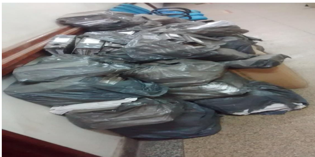
Figura 2 - Documentos do Estado determinado departamento do Estado do Amapá

O Estado do Amapá assumiu a condição de unidade federativa nacional no ano de elaboração da constituição de 1988. Atualmente, com 30 anos de existência, os documentos produzidos no estado estão amontoados em galpões fechados como entulhos, parte deles, em péssimo estado de conservação, como se pode observar na imagem em exposição (figura 2). Outros esquecidos e/ou escondidos em arquivos particulares. Esse fato indiscutivelmente influi na sociedade, posto que tolhe o desenvolvimento social, cultural e científico local, mais crítico ainda, obscurece a memória e sem dúvida, a identidade regional.