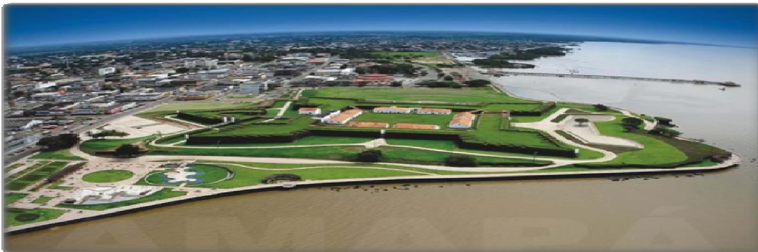
Figura 1 -A cidade de Macapá com destaque, em primeiro plano de seu maior monumento cultura – a Fortaleza São José