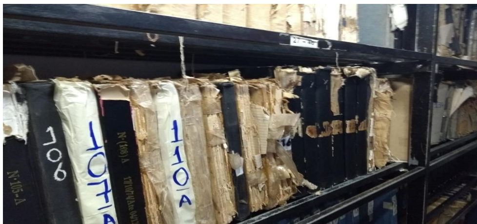
Figura 6 - cartório Jucá