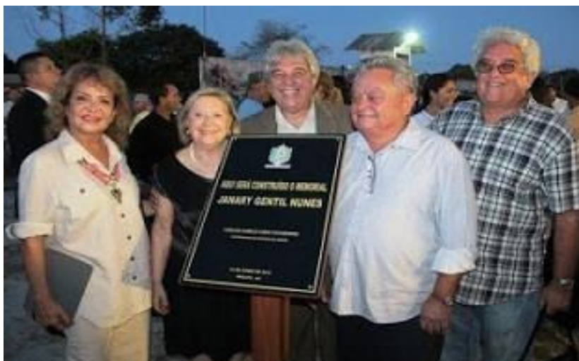
Figura 3 - Lançamento da pedra fundamental do Memorial Janary Nunes