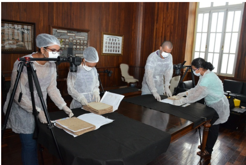
Imagem 2: Equipe realizando o processo de digitalização no Tribunal de Justiça da Paraíba.