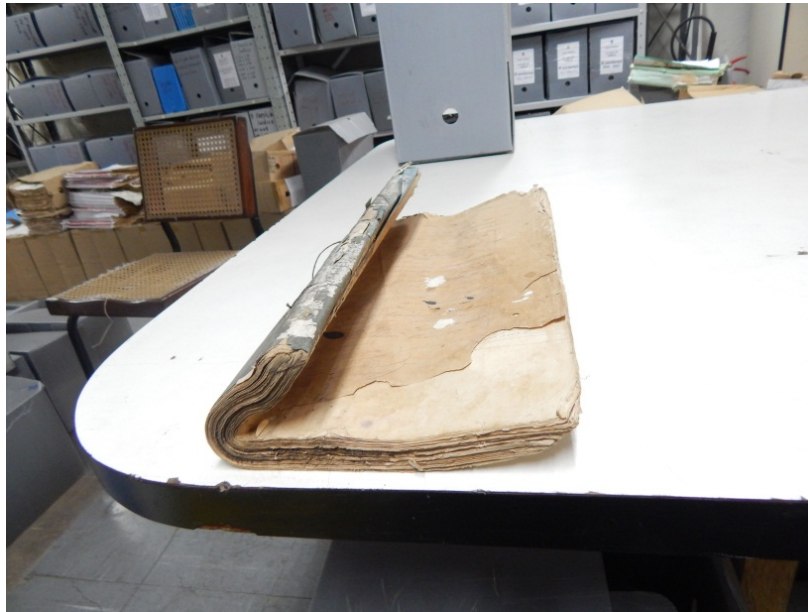
Imagem 3: Documento totalmente dobrado, causado pelo mau acondicionamento.