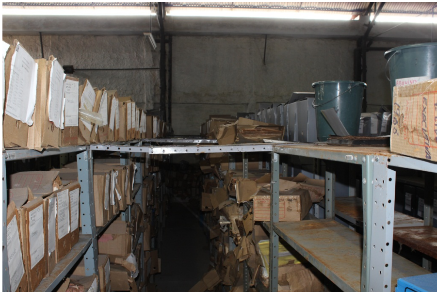
Imagens 1: Arquivo do Fórum Cível Desembargador Mário Moacyr Porto, em João Pessoa.

A imagem 1 mostra a situação do Arquivo do Fórum Cível Desembargador Mário Moacyr Porto, em João Pessoa, do qual necessita de uma nova infraestrutura e organização, visto que muitos dos itens documentais digitalizados pela equipe do projeto não constam no sistema de informação do Fórum em questão, alguns foram inclusive encontrados no chão.