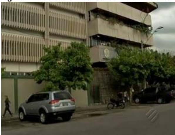
Figura 1 - Secretaria Estadual de meio ambiente – SEMAS