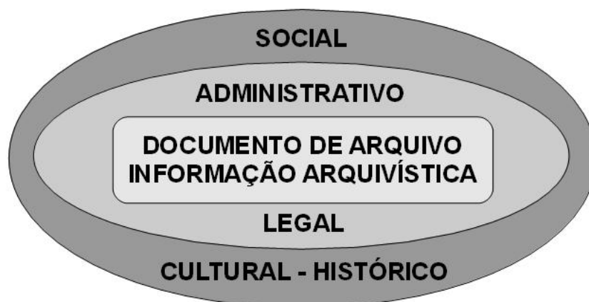
Figura 1 – Aspectos dos Documentos e Informações Arquivísticas

Fonte - Com base nos autores: Lustosa (2004); Rego (2000); Jardim (1999, 1995); Araújo (1992)