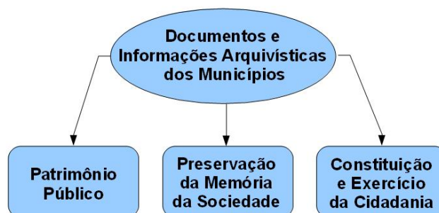
Figura 2 - Dimensão dos Documentos e Informações Arquivísticas Municipais

Base de preservação da memória da sociedade – Os documentos devem ser conservados e organizados de forma que sejam um espaço para a pesquisa histórica, Isto significa não só criar condições para que os pesquisadores realizem suas pesquisas, mas para que a sociedade possa constituir e reforçar sua identidade cultural.