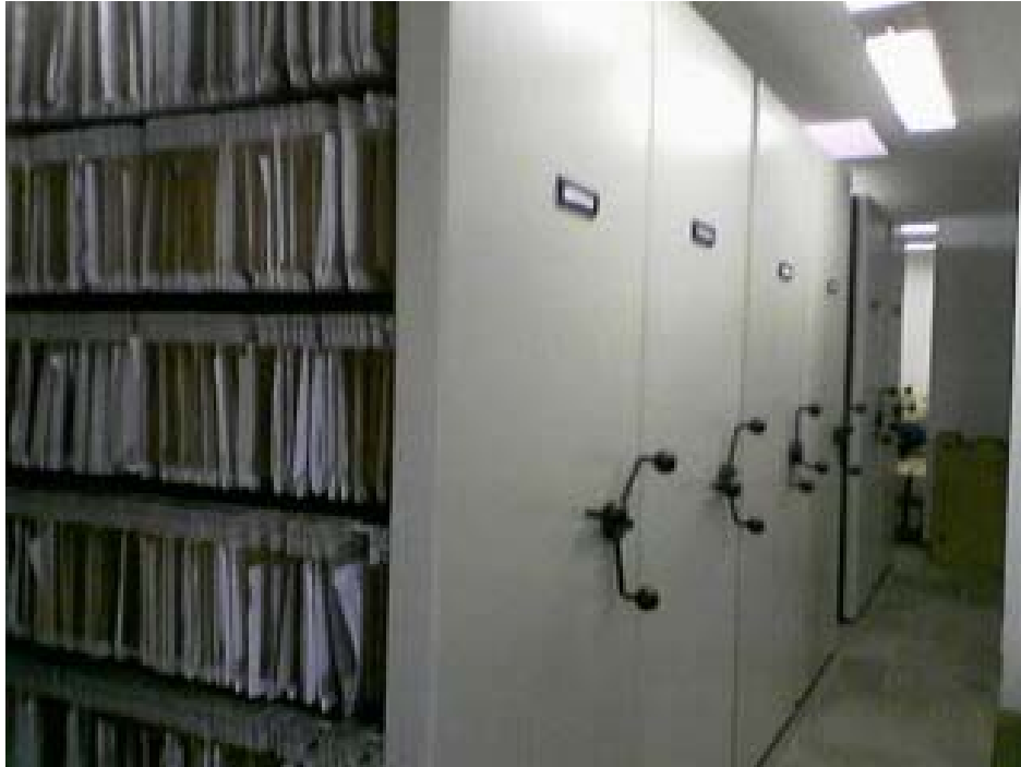
Módulos de archivo deslizantes