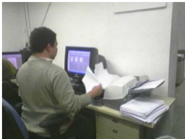
Setor de Digitalização