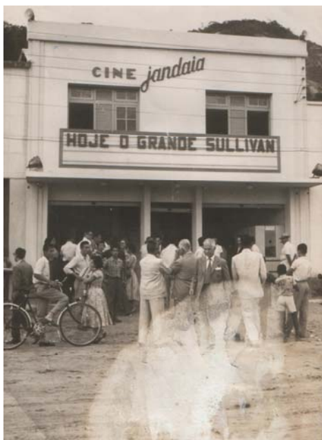
IMAGEM 4 – Foto do Cine Jandaia: O cinema estreou com o filme O GRANDE SULLIVAN, em 22 de julho de 1955. Sala de propriedade da Empresa Dionysio Abaurre Com.Itda.

É necessário nesse contexto avaliarmos até onde os acervos pessoais, “tão procurado pelos historiadores por sua capacidade de revelar as sensibilidades de uma pessoa e, por extensão, de um grupo, poderiam colaborar para a obtenção de um entendimento mais sutil dos fenômenos da memória coletiva” (VIDAL, 2007, p.7). Todos os entrevistados tiveram alguma participação na atividade de exibição cinematográfica, sendo assim, em algum momento suas histórias individuais se misturaram a história coletiva da exibição cinematográfica no estado.