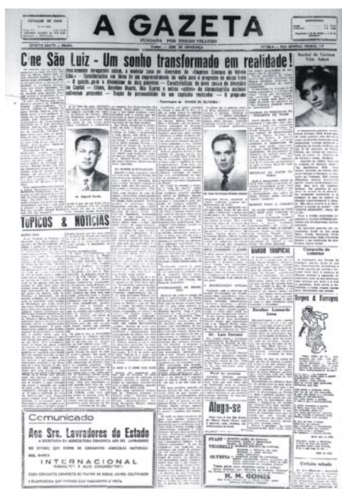
IMAGEM 1 - Capa do Jornal A Gazeta sobre a inauguração do Cine São Luiz, em 1951, que contou com a presença de autoridades e o elenco do filme AVISO AOS NAVEGANTES, entre eles Eliana, Anselmo Duarte e Ilka Soares, uma chanchada de grande bilheteria lançado pela Atlântida.

Os jornais, além de servir como fonte de informação noticiosa e narrativa ideológica, para demandas específicas, agrega elementos virtuais valiosos a partir do momento que a fotografia passa a ser utilizada na história da imprensa. Essas imagens sempre vêm acompanhadas de um contexto e uma legenda que favorece a identificação e a contextualização das mesmas. Outro item importante na utilização dessa fonte é a infografia, e no nosso caso, os anúncios dos filmes, da inauguração das salas, das grandes estréias que ocupavam por vezes as páginas inteiras ou até mesmo o destaque da capa. (TEIXEIRA, 2008, p.67)