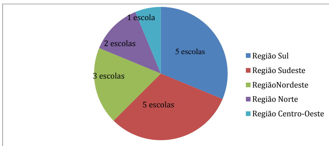
Distribuição das escolas de Arquivologia, por regiões brasileiras

De acordo com o Conselho Nacional de Arquivos (CONARQ), o Brasil possui 16 escolas de Arquivologia, distribuídas em diferentes regiões brasileiras, conforme ilustrado no gráfico 3.