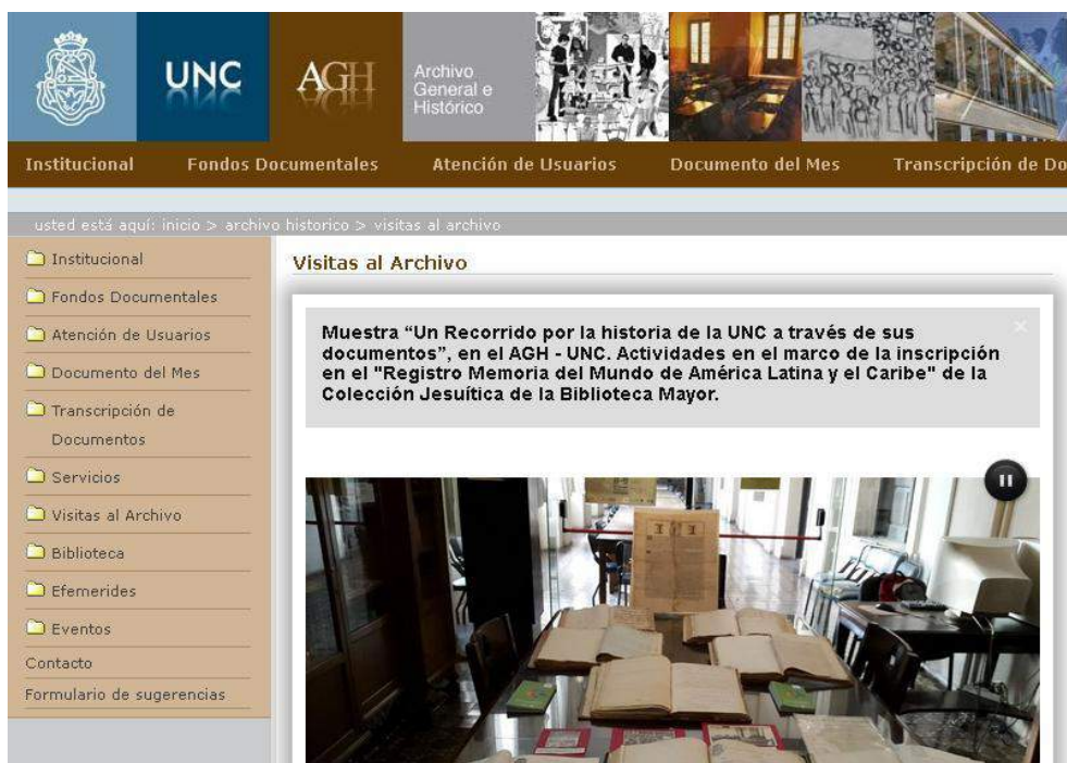
Captura de Pantalla. Sección Visitas al Archivo de la web del AGH http://www.archivodelauniversidad.unc.edu.ar/visitas-al-archivo