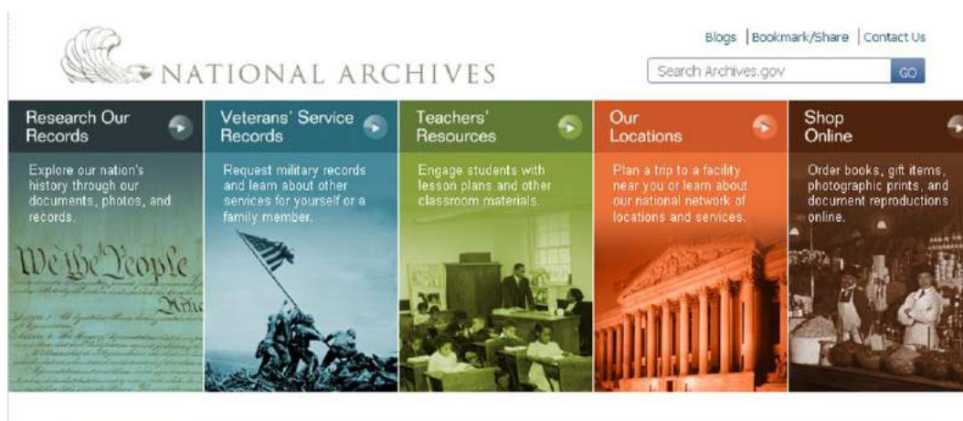
Site do Arquivo Nacional dos Estados Unidos, página inicial, 2013.