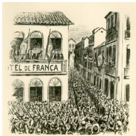
Imagem 2: Charge retratando o discurso de Rui Barbosa a partir da sacada do Hotel de França, conclamando os soldados que retornavam da Guerra do Paraguai a participarem da luta pela abolição da escravidão.