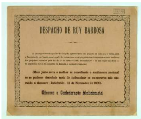
Imagem 1: Documento textual impresso - Diploma conferido a Rui Barbosa pela Confederação Abolicionista, em homenagem à sua atuação contra a causa de indenização dos ex-proprietários de escravos.

O corpus documental selecionado para uso no módulo inclui documentos iconográficos (fotografias, charges e caricaturas) e documentos textuais (correspondências, documentos oficiais, cartões de visita e periódicos antigos). Os documentos selecionados fazem parte do arquivo pessoal de Rui Barbosa, da sua coleção de jornais e documentos avulsos, do arquivo pessoal de Ubaldino do Amaral, da Coleção Família Barbosa de Oliveira e da Coleção Plínio Doyle.