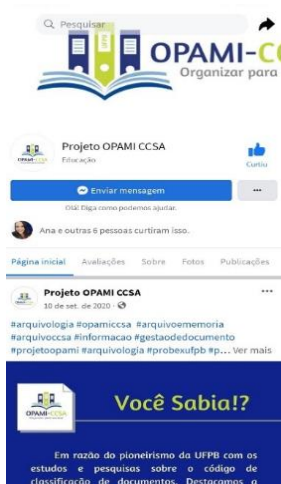
Figura 4 - Facebook