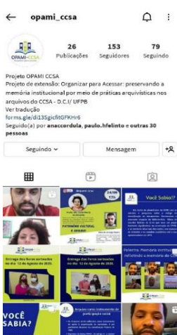
Figura 3 - Instagram