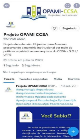
Figura 5 - Twitter