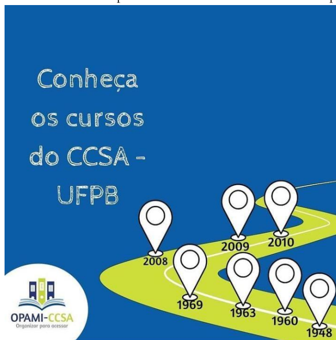
Figura 1 - Linha do Tempo do Centro de Ciências Sociais e Aplicadas