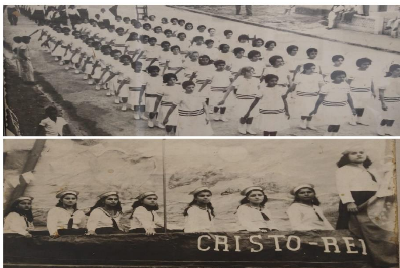
Imagem 3 - Festas Cívicas do Colégio da Luz