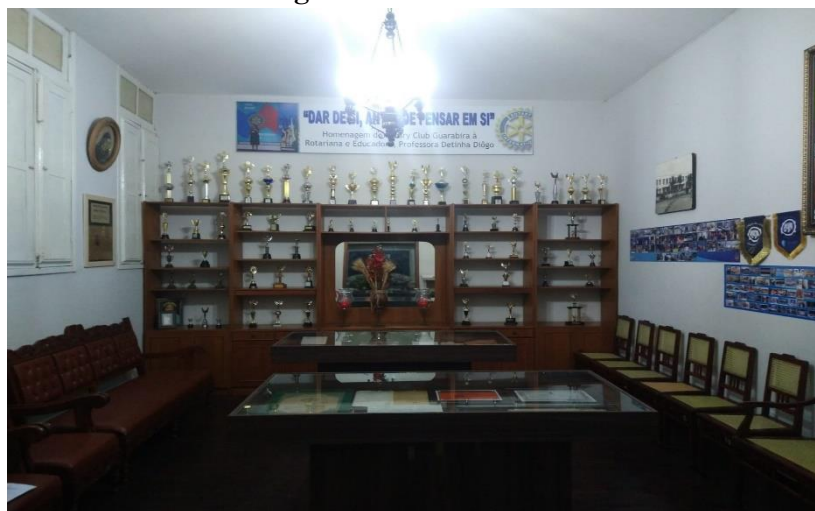
Imagem 5 - Memorial da Luz

longo da sua jornada. A escolha destes registros é feita pela diretoria, e não por profissionais arquivistas na construção e/ou seleção do acervo.