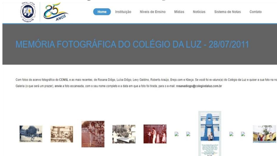
Imagem 6 - Acervo Fotográfico Virtual

Fonte: Memorial fotográfico Colégio da Luz, 2022.