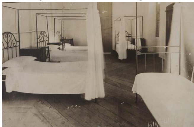
Imagem 2 - Dormitórios do Colégio da Luz