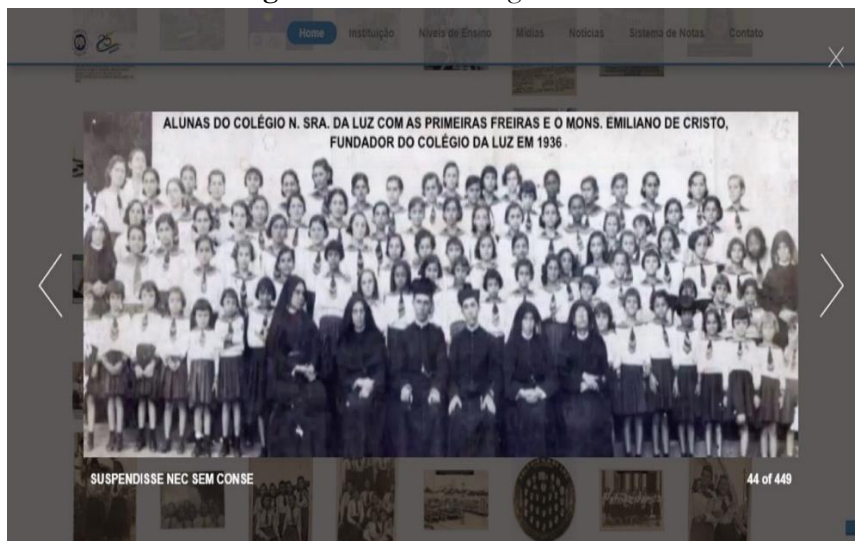
Imagem 7 - Acervo Fotográfico Virtual