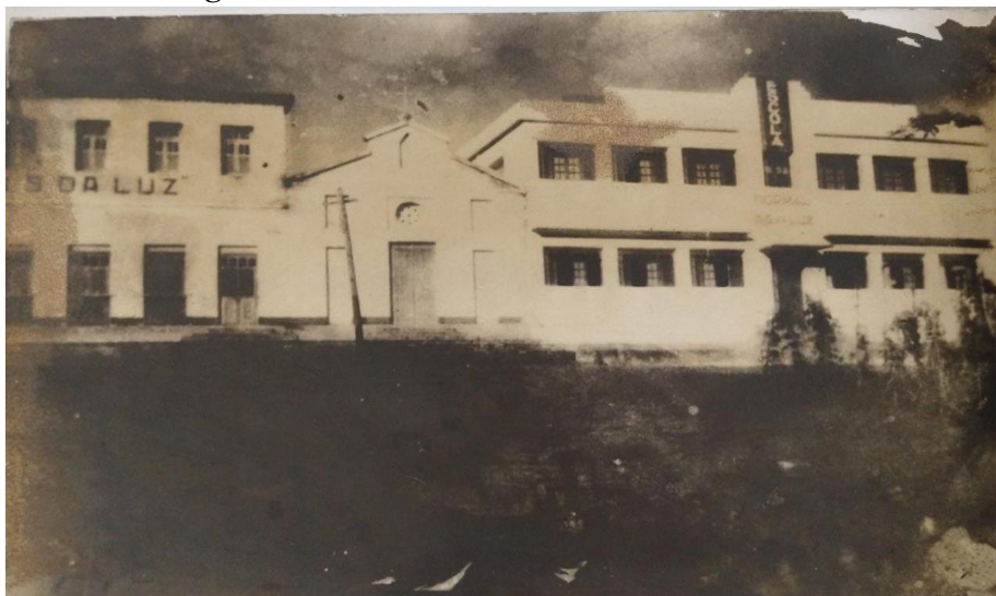
Imagem 1 - Estrutura da Escola no final da década de 30