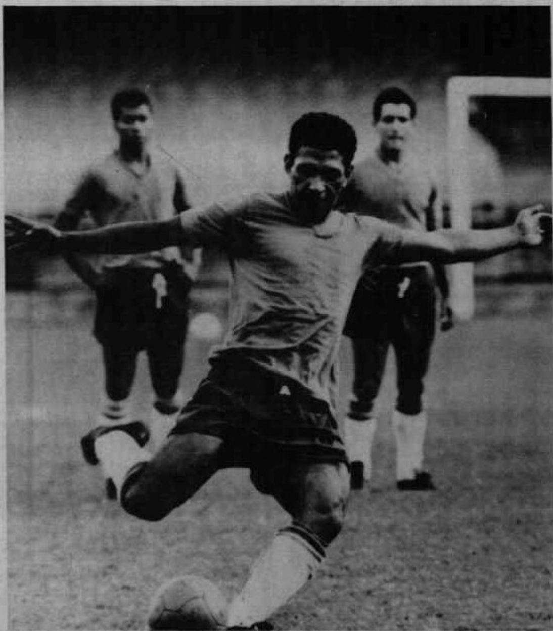
Garrincha. Rio de Janeiro, maio de 1965. Correio da Manhã .

ção é formada por fotografias de proveniência desconhecida e que não possuem relação orgânica, doadas por membros das classes dominantes. É constituída por retratos de crianças, militares,