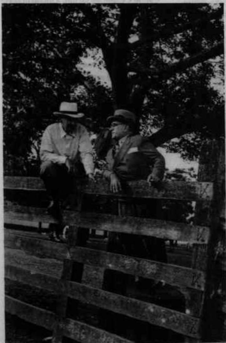
Getúlio Vargas em sua fazenda. São Borja, (RS), 1939.

cômodos, seus móveis... Também para a análise das fotografias contemporâneas a compreensão dos avanços tecnológicos é fundamental, principalmente na área de foto-jornalismo. É imprescindível no momento da interpretação compreender que a diversidade de abertura do diafragma, a velocidade do filme e a mobilidade da máquina fotográfica - ao absorver o movimento da fotografia,