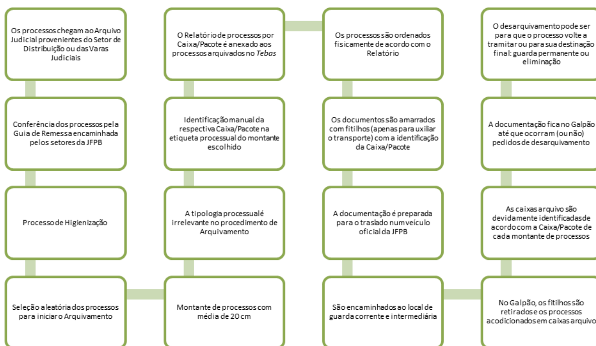
Figura 3 – Fluxo documental.

Além do que foi apresentado até agora, a partir da observação e pesquisa descritiva, também como resultante deste estudo, criamos uma representação imagética (figura 3) de como ocorre o do fluxo documental a partir da perspectiva do processo (entendido aqui como documento). Acreditamos que desta forma, facilitará visualmente a sequência das principais etapas dos procedimentos realizados no Arquivo Judicial.