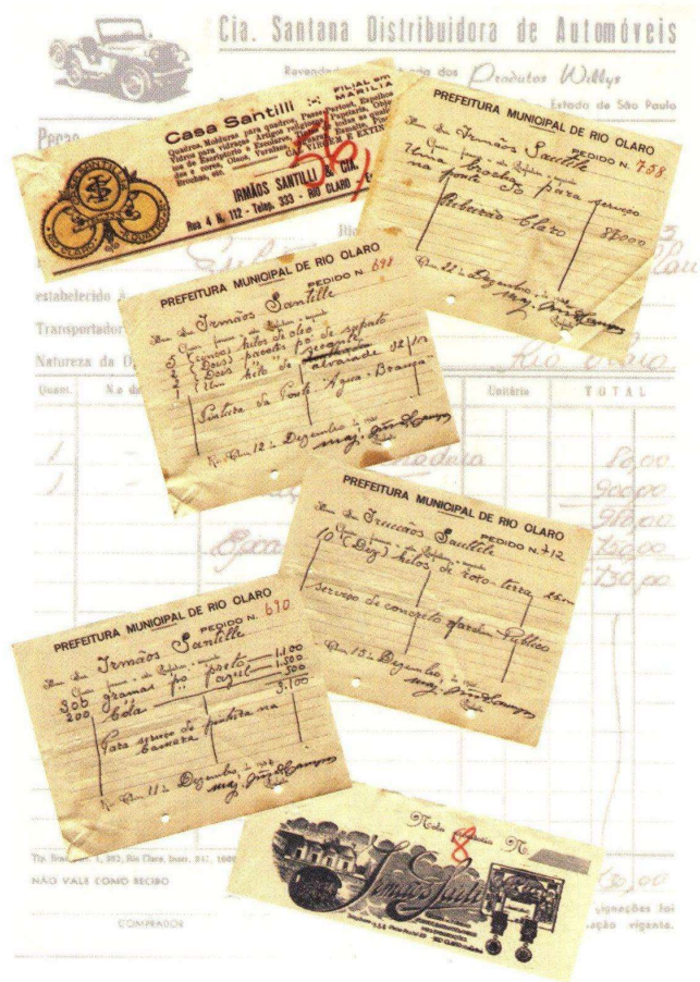
Comprovantes da liquidação das despesas realizadas pelo Município.

Trata-se de comprovante único da liquidação das despesas realizadas pelo Município, onde encontramos os recibos fiscais das operações efetuadas. Com o decorrer do tempo, os valores fiscais e legais que deram origem a sua criação desaparecem, dando lugar a outros, de interesse dos pesquisadores. Podem servir como uma das fontes para a recuperação da história do comércio de nossa cidade em um determinado período, bem como para análise do aspecto artístico registrado nos documentos comerciais da época.