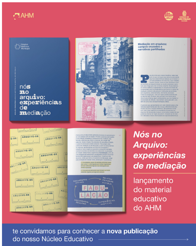
Figura 5 – Divulgação do evento de lançamento do material educativo Nós no arquivo: experiências de mediação. Diagramação de Rayza Mucunã Paiva (Núcleo de Comunicação e Produção Cultural do AHM)

O material é composto por um livreto, duas fichas catalográficas para serem preenchidas, 14 reproduções de documentos em formato A5 e três reproduções em formato A3. Todos os impressos são acomodados no interior de uma caixa de papel kraft, fazendo referência à guarda da documentação arquivística. O livreto é dividido em duas seções, a primeira delas com textos teóricos e curtos que introduzem o tema da educação em arquivos e uma bibliografia de referência. Já a segunda seção traz proposições práticas que podem ser aplicadas nos espaços de educação utilizando as reproduções do próprio material e/ou outros documentos mobilizados pelos proponentes das atividades. Todos os documentos reproduzidos contêm legendas expandidas, a fim de contextualizar e suscitar reflexões naquele que os lê.