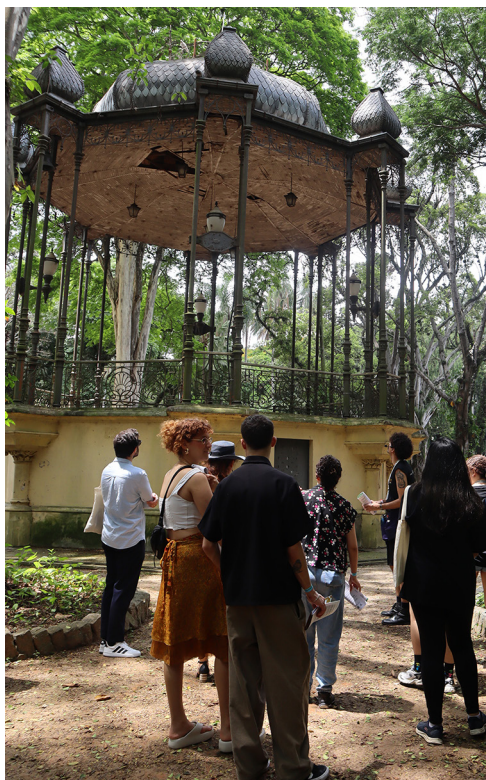
Figura 3 – Registro da atividade Arquivo nômade: Postais na praça , 7 de março de 2025.