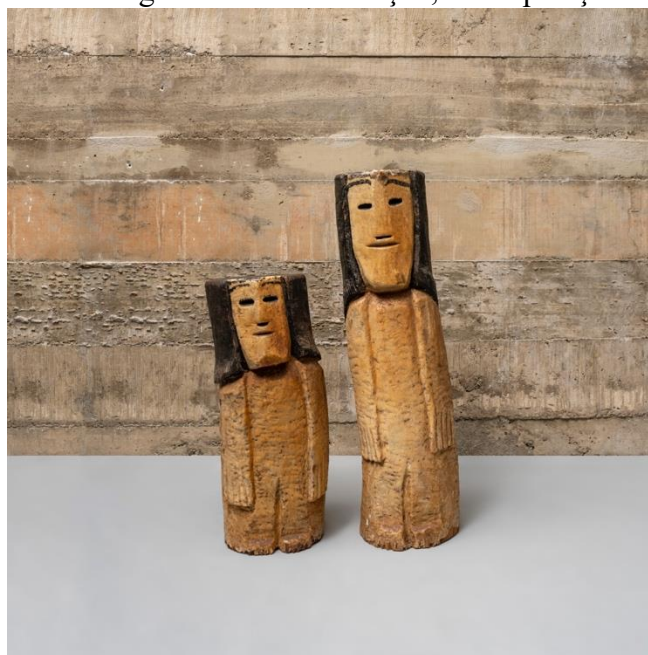
Figura 4 – Os “bugrinhos” de Conceição, em exposição no MASP.