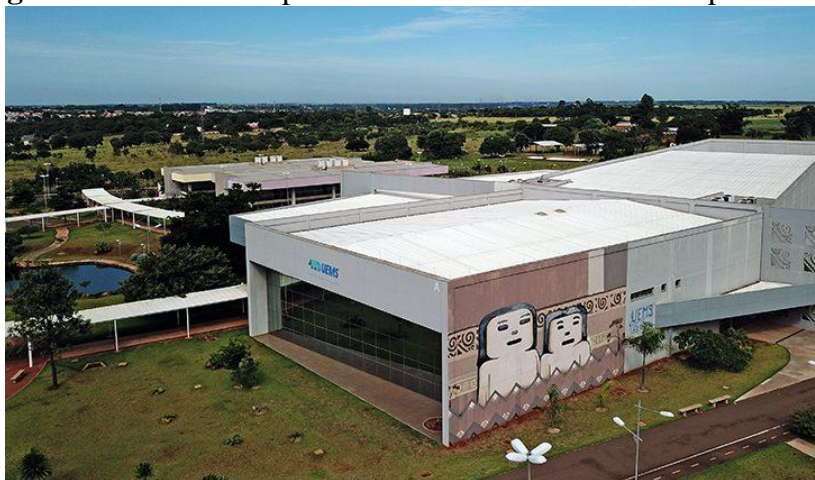
Figura 5 – Fachada do prédio central da UEMS em Campo Grande.