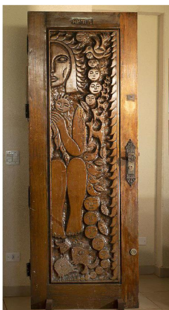
Figura 1 – Folha de entrada da porta do apartamento de Glorinha