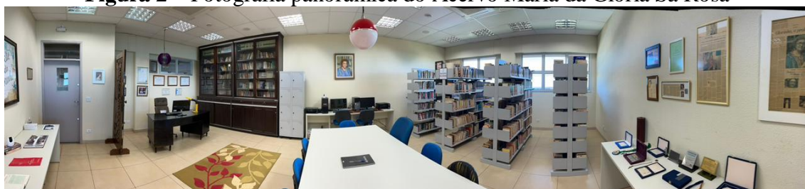
Figura 2 – Fotografia panorâmica do Acervo Maria da Glória Sá Rosa

A terceira categoria é composta por objetos variados, como o mobiliário original de seu escritório (estante, escrivaninha, cadeira), a porta de seu apartamento, esculpida pelo artista Ilton Silva, além de peças de decoração (luminárias, artesanato sul-matogrossense e souvenirs), quadros (há um autorretrato), títulos, medalhas, faixas e placas comemorativas.