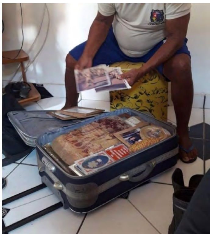
Figura 7 – Acervo Pessoal do Ex GT

A Figura 6 apresenta o noticiário do relatando a criação da PM no ex Território Federal do Amapá, que compõe o acervo pessoal de um ex membro da GT, como podemos ver muito da história e da identidade e memória dos ex praças se encontram em seus arquivos pessoais, como símbolo de força mérito e honra aos serviços prestados em tempos de glória ao estado. Hoje essa memória vem sendo construída devido aos esforços e iniciativas das pesquisas como por exemplo, as que realizamos em conjunto com a Universidade Federal do Amapá, buscando trazer a identidade e a história desses personagens ilustre do povo amapaense.