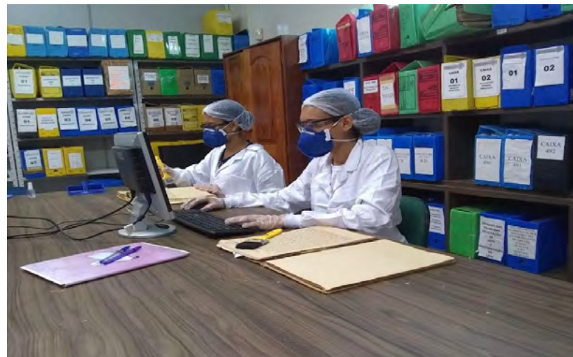
Figura 4 - Higienização e catalogação de documentos