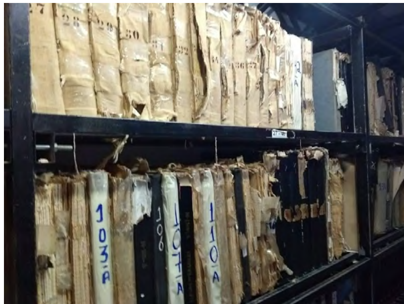
Figura 2 – Livros do Registro Civil