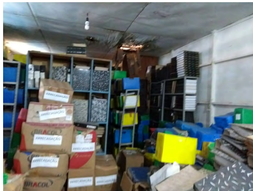
Figura 1 – Arquivo de Órgão de Saneamento do Estado do Amapá