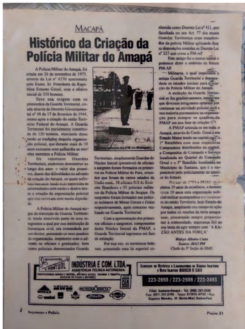
Figura 6