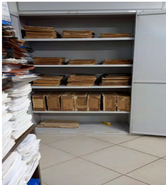
Figura 5 – Armário I do Acervo Fundiário do Amapá Terras