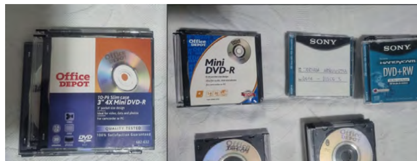
Figura 1 – Tipos de mídias utilizadas nas gravações da Jornada Arquivística

As mídias físicas da Jornada Arquivística fazem parte de um conjunto de 46 mini discos (DVD). As filmagens foram realizadas por uma câmera de vídeo em DVD – modelo Samsung SC-DC173, a qual suporta as mídias: DVD-R; DVD+R DL; DVD-RW; DVD+RW.