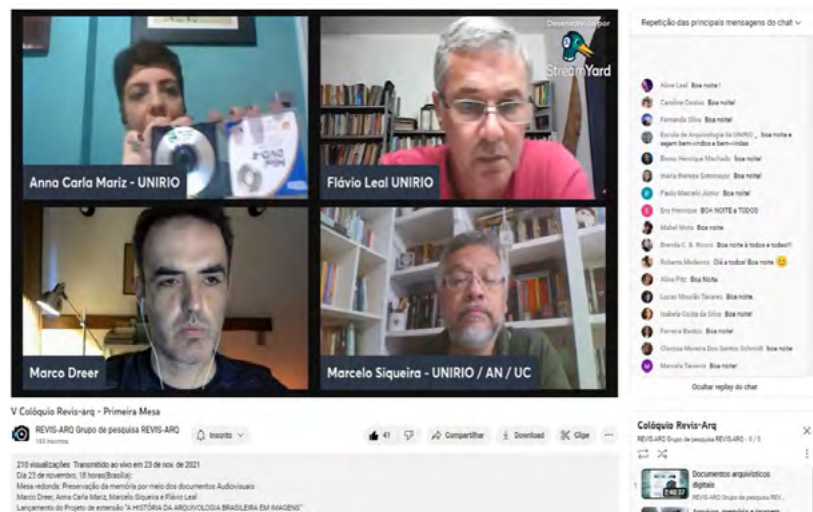
Figura 6 – Live no youtube do V Colóquio Revis-Arq