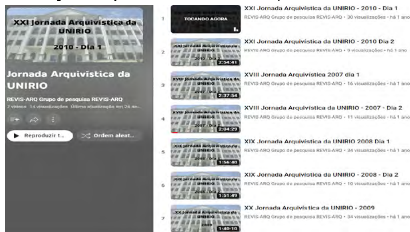
Figura 5 – Playlist com os vídeos da Jornada Arquivística da UNIRIO