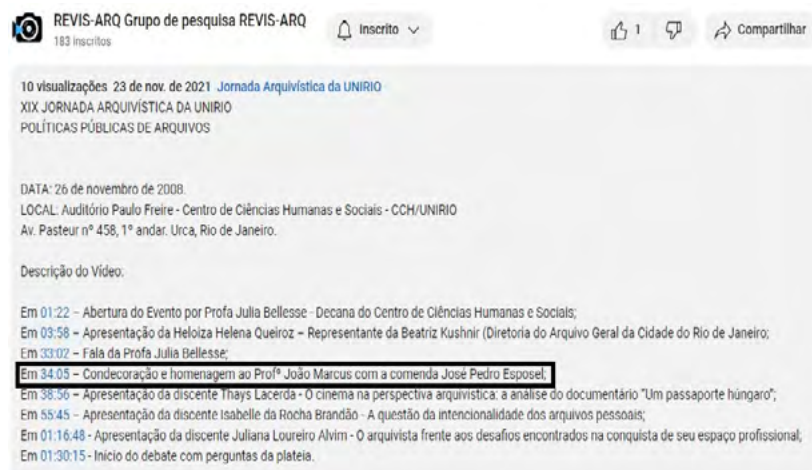
Figura 4 – Exemplo da descrição criada para facilitar o acesso na plataforma do Youtube

Durante o processo de revisão e preparação dos vídeos no programa Adobe Premiere Pro CC, foi realizado um trabalho de identificação e descrição dos momentos e apresentações nos vídeos. O intuito de criar um modelo de descrição para ser incluído na plataforma do youtube é justamente pensado para facilitar o acesso direto aos usuários aos temas de seu interesse, que permite saber exatamente em que minuto do vídeo está o que procura.