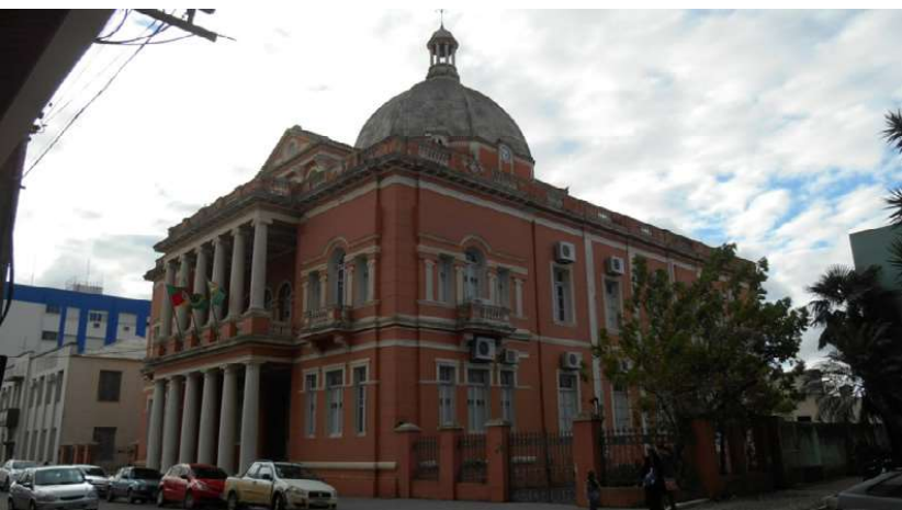
Figura 6: Prefeitura Municipal - 2017

A Prefeitura Municipal fica localizada no centro da cidade, sofrendo apenas uma alteração - o muro foi trocado por grades.