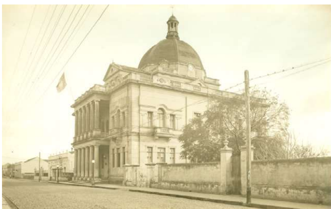
Figura 5: Prefeitura Municipal

A Prefeitura Municipal começou a ser construída em 1918 recebendo o nome de Palácio Plácido de Castro (em homenagem ao desbravador do Acre). A planta da obra era a cópia fiel do “Capitólio” norte-americano. Em 1924 foi concluída, sendo inaugurada no mesmo ano.