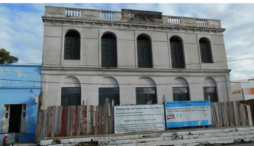
Figura 10: Theatro Harmonia –restauração/2017

Em 2007, o Theatro Harmonia foi comprado pela Prefeitura Municipal. Atualmente o prédio está na primeira etapa de restauração, através do projeto Pró-Cultura RS, Lei nº 13.490/10 - lei de incentivo à cultura que antecipa a compensação de recursos destinados ao pagamento do ICMS por parte das empresas que financiam projetos culturais.