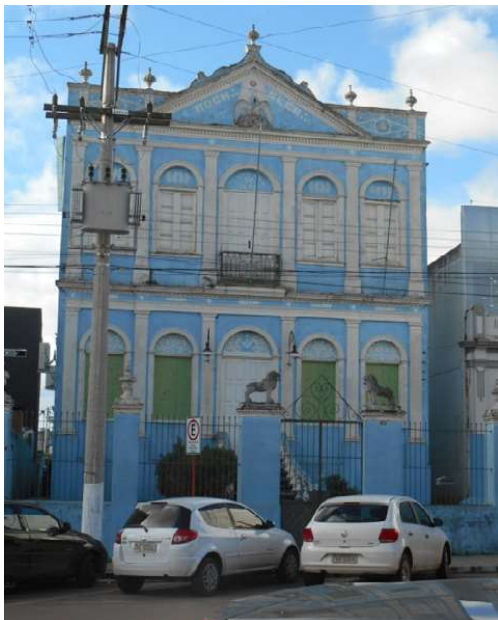
Figura 4: Loja Maçônica Rocha Negra- 2017

Loja Maçônica Rocha Negra nos dias atuais, não recebeu nenhuma alteração.