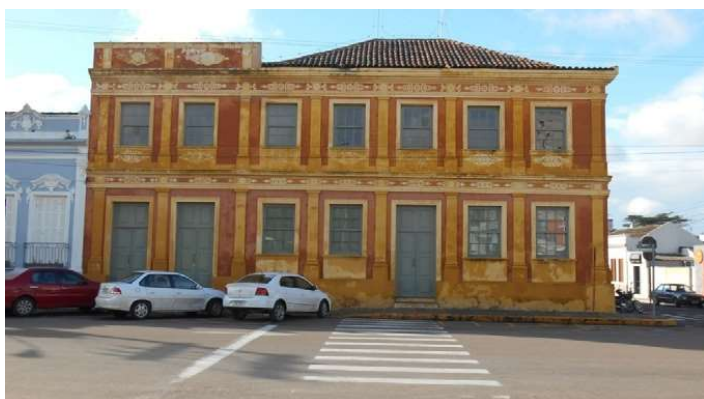
Figura 8: Centro de Cultura Sobrado da Praça

Hoje o prédio é o Centro de Cultura Sobrado da Praça, que abriga a Biblioteca Pública Municipal, o Conservatório Municipal e a Secretaria Municipal de Turismo. No Centro de Cultura ocorrem palestras, recitais e exposições fotográficas. O Sobrado fica localizado em frente à Praça Dr. Fernando Abbott, no centro da cidade.