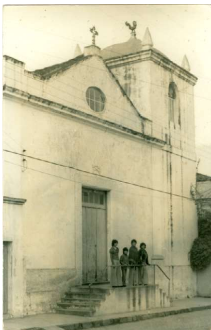
Figura 1: Igreja Nossa Senhora do Rosário Bom Fim

Em 1817, conhecida como Igreja do Galo, a Igreja Nossa Senhora do Rosário Bom Fim foi o primeiro templo de alvenaria levantado em São Gabriel, sua torre tinha um galo de bronze, que em 1985 foi roubado.