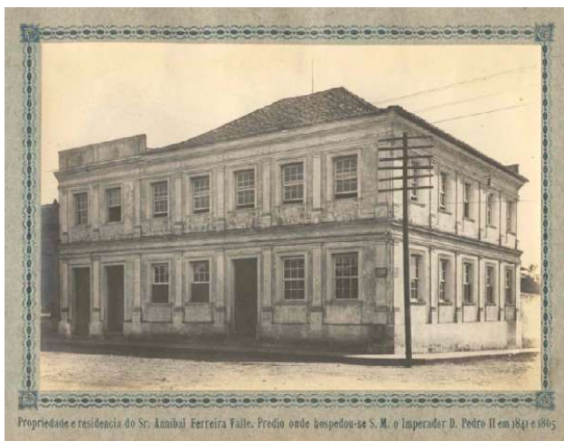
Figura 7: Sobrado da Praça

Construído no ano de 1826 pelo português Francisco José de Carvalho, era uma edificação particular. Em 24 de setembro de 1974 foi tombado pelo Instituto do Patrimônio Histórico e Artístico Nacional. O Sobrado possui algumas histórias orais, entre elas a de que o Imperador Dom Pedro II ali se hospedou em 13 de janeiro de 1846.