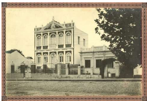
Figura 3: Loja Maçônica Rocha Negra